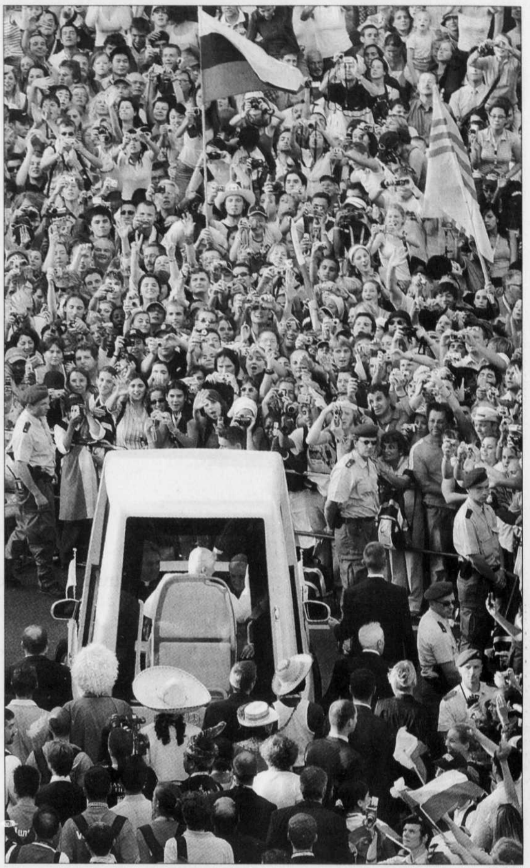
Si les JMJ sont portées au panthéon du mystérieux et de l'inexpliqué par autant d'intervenants, d'observateurs et de journalistes, c'est peut-être que nous faisons l'économie d'une élémentaire mise en perspective qui nous inviterait à considérer autrement ce « Woodstock de la foi ».

Il y a un risque réel, tant pour l'Église catholique que pour la société, d'astreindre les quêtes de sens des jeunes au territoire exclusif de ce grand festival des superlatifs que sont les Journées mondiales de la jeunesse. Si nous n'avons d'yeux que pour ce type de rassemblements, lorsque se posent de manière fondamentale et urgente les incontournables questions de sens chez les jeunes, sommes-nous vraiment sur le bon terrain pour les accueillir et les accompagner?