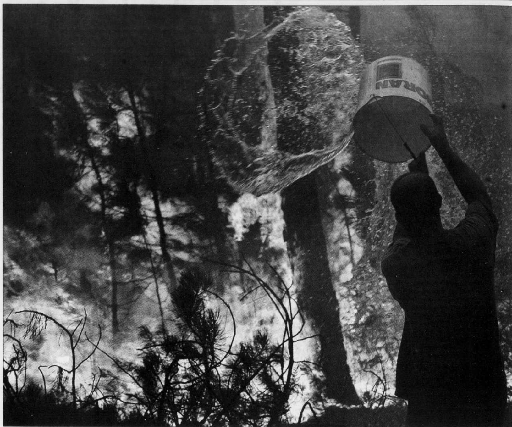
L'intervention de ce simple citoyen d'Abrantes, dans le centre du Portugal, peut sembler dérisoire, mais toute aide est la bienvenue quand il s'agit de combattre les incendies de forêt.

Munich, Allemagne — La femme qui a mis en vente en juin la maison natale du pape Benoît XVI a annoncé avoir déjà reçu plus de 400 offres, y compris une d'un montant de neuf millions d'euros. Claudia Dandl vend sa maison blanche et jaune de deux étages dans le village bavarois de Markt am Inn, n'arrivant plus à gérer l'afflux croissant de curieux frappant à sa porte ou cherchant à jeter un coup d'œil par la fenêtre depuis l'élection du pape. Selon une porte-parole de la famille Dandl, qui n'a pas précisé d'où provenait l'offre la plus élevée, 20 à 30 de ces propositions semblent sérieuses. Parmi les acquéreurs potentiels, on trouve même une société des Émirats arabes unis. — AP