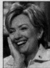
Hillary Clinton en croisade

Dangereux, les jeux vidéo? Après la violence au petit écran, voici que nos voisins du sud s'attaquent aux médias interactifs, nouveau fer de lance d'Hillary Clinton, qui a trouvé auprès de l'American Psychological Association (APA), un appui inespéré. La puissante organisation a même adopté vendredi une résolution d'urgence recommandant que la violence soit réduite dans les jeux vidéo et interactifs destinés aux enfants et aux adolescents, faute de quoi, cette génération pourrait bien en payer le prix.