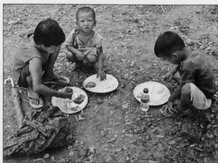
Un jeune Asiatique sur trois est dans un état de pauvreté absolue.

Quelque 250 millions d'autres jeunes n'ont pas accès à l'un de ces services, portant à 600 millions le nombre d'enfants pauvres dans la région.