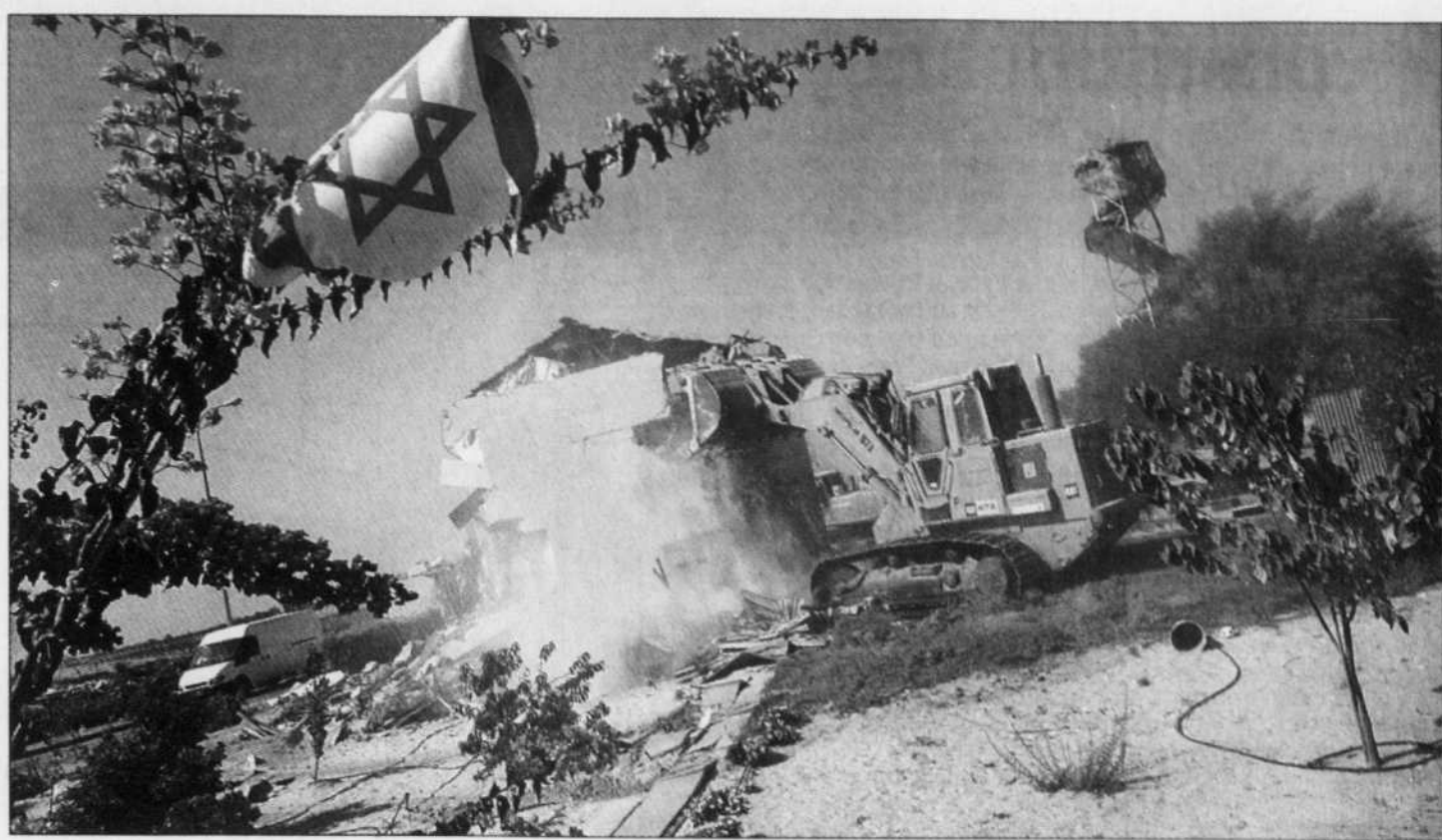
Israël a commencé la démolition des maisons des colons de Morag.

Quito — Les dirigeants d'un mouvement de protestation, qui paralyse l'extraction de pétrole dans la principale région productrice de brut en Equateur, ont entamé hier à Quito des négociations avec le gouvernement, en réaffirmant devant la presse leurs revendications. Le ministre de l'Intérieur, Mauricio Gandara, a reçu en milieu de journée des représentants des provinces d'Orellana et de Sucumbios, situées en Amazonie équatorienne où se concentre l'activité pétrolière. Les protestataires avaient occupé lundi dernier quelque 200 puits pétroliers dans la région, réclamant une renégociation des contrats avec les compagnies du pétrole étrangères, la construction de routes et l'emploi de main-d'œuvre locale. Dimanche, les manifestants ont décrété une trêve pour faciliter les discussions avec le gouvernement, mais ils ont averti hier que leurs revendications n'avaient pas changé. — AFP