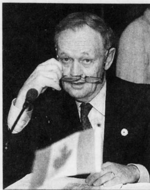
Le premier ministre Jean Chrétien participe au sommet des dirigeants du Commonwealth, à Coolum, en Australie.

Les pays africains continuent de faire bloc autour du Zimbabwe contre l'ancien pouvoir colonial britannique en s'opposant aux sanctions contre le régime du président Mugabe, ce qui accentue le désaccord au sommet du Commonwealth en Australie.