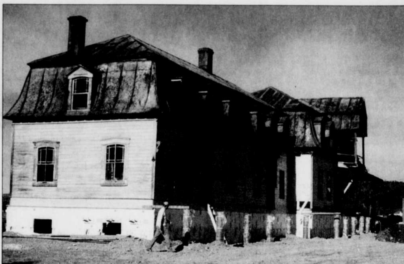
COLLABORATION SPÉCIALE, GILLES GAGNÉ

La maison Legrand, de Port-Daniel, change progressivement d'allure. L'échéancier du chantier est respecté et huit personnes travaillent à sa rénovation, qui survient après un abandon de 30 ans qui a bien failli emporter le bâtiment. La maison a été déplacée et installée sur un solage au cours des dernières semaines. Environ 665 000 $ sont consacrés à la restauration de ce qui fut jadis le premier hôtel de villégiature de Port-Daniel, à l'époque où le village constituait le terminus du chemin de fer gaspésien. La vocation future du bâtiment n'est toutefois pas encore entièrement arrêtée. Il est question d'y installer une bibliothèque, des bureaux, peut-être ceux de la municipalité, et un attrait touristique ou culturel. G.G.