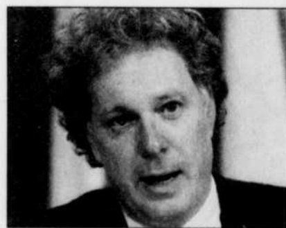
Jean Charest convoite cette région