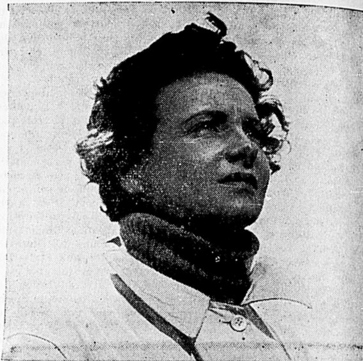
Gisèle Pascal, interprète du rôle de Hélène Boucher dans le film "Horizons sans fin" qui prendra l'affiche dès samedi au Cinéma de Paris. En programme double: "Une Jeune Fille Sage", avec Lilia Silvi.