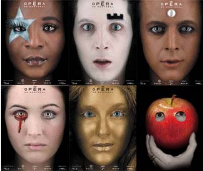
Les 6 ffiches de l'Opéra de Montréal