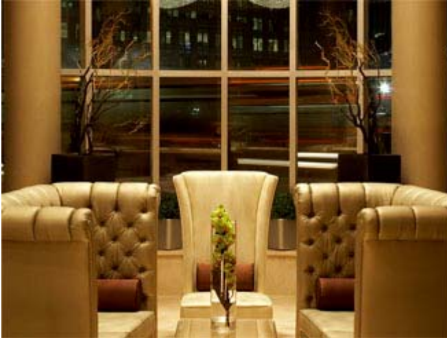
Hall d'accueil du Crystal Montréal