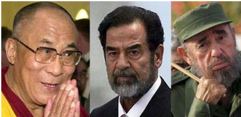
Dalai Lama, Saddam Hussain et Fidel Castro

Les observateurs de la scène politique doutent du succès de la lutte que mène le Dalai Lama (72 ans) contre la Chine . La raison est économique et peu d'entreprises sont disposées à ignorer le potentiel que ce pays représente. De grands diffuseurs de produits Internet comme Yahoo et Google acceptent les règles imposées par le Gouvernement chinois car autrement ce serait l'interdiction totale de transiger sur ce territoire. On peut comparer cette