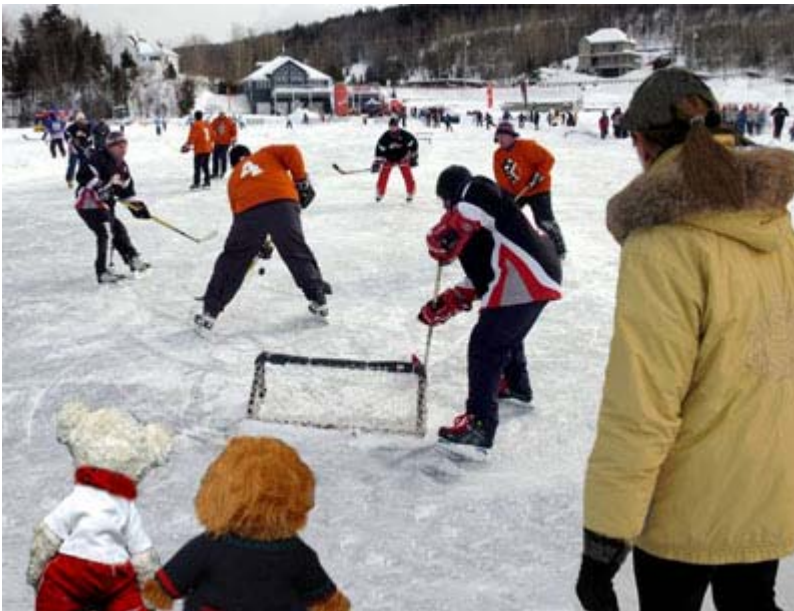
Mademoiselle X et les deux mascottes, Miss Gym et son frère Monsieur X, sur une patinoire extérieure au Lac Beauport à Québec.

«Je ne parle pas aux cons, ça les instruits.» Audiard