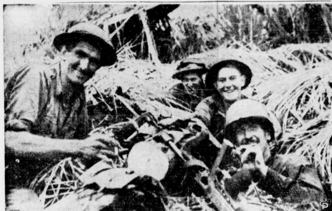
Après avoir descendu un chasseur "Zero", ces soldats australiens ont décidé de se reposer un peu pendant qu'on les photographiait. Cette photographie fut prise à la pointe Giropi, dans la péninsule du Papua, au cours de la bataille de Buna.