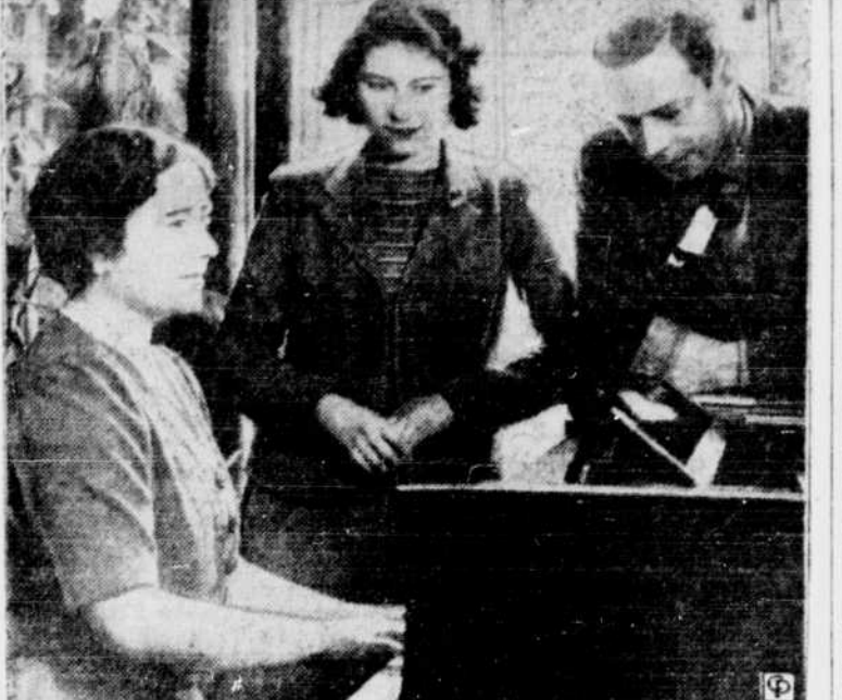
La majesté de la reine Elisabeth se tenant sur le piano tandis que la reine Elisabeth exécute pour eux quelques morceaux. La famille royale, comme des millions d'autres familles, goûte les joies familiales. La photo a été prise dans une des résidences de campagne de la famille royale.