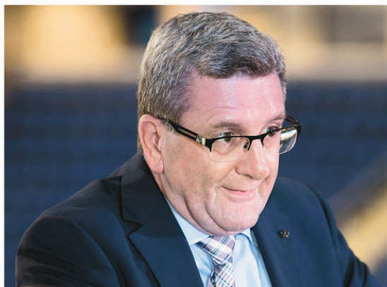
FRANCIS VACHON LE DEVOIR

Mais attention, certains contribuables vont subir des hausses de taxes malgré tout. C'est le cas des résidents de l'ancienne ville de Québec qui doivent payer la dette antérieure aux fusions. Les contribuables de certaines anciennes