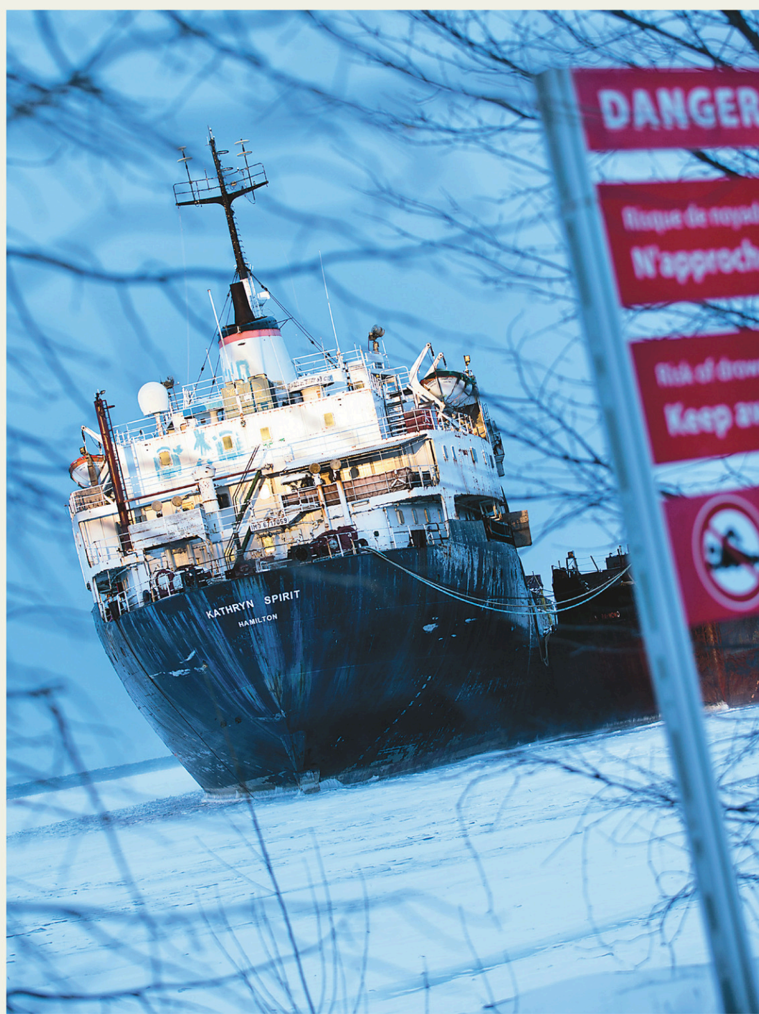
ANNIK MH DE CARUFEL LE DEVOIR

Un vieux navire laissé à l'abandon sur le Saint-Laurent, à Beauharnois, risque de se renverser et de déverser ses eaux contaminées dans le fleuve, en amont des prises d'eau de Montréal. Page A 3