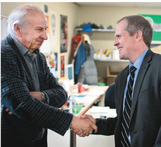
JACQUES NADEAU LE DEVOIR Bernard Descôteaux et Brian Myles