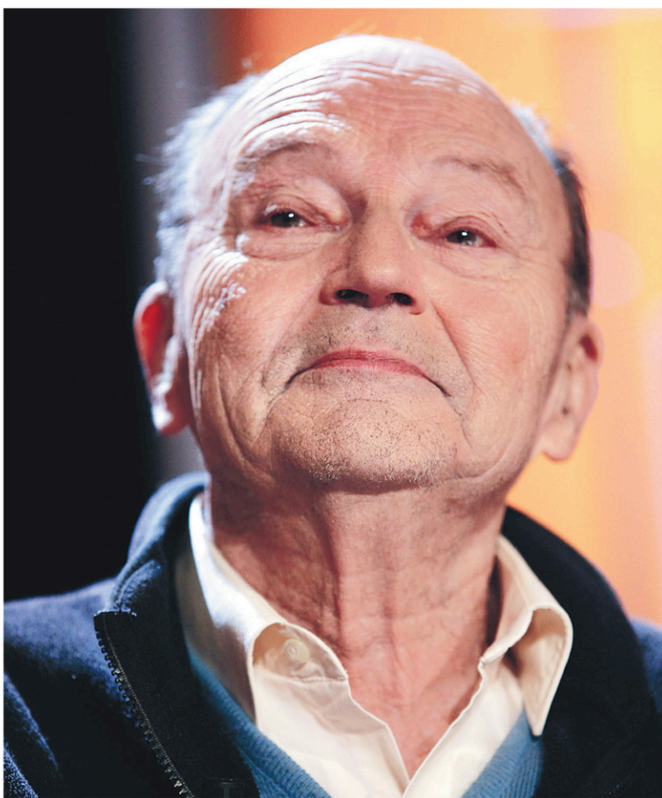
Michel Tournier est mort lundi à l'âge de 91 ans.