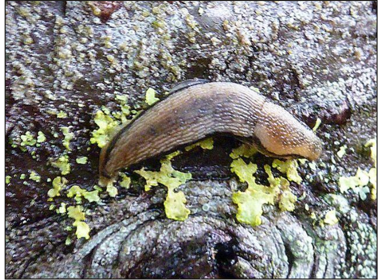
Figure 2. Limace broutant des lichens.

Frédéric nous avait convié à cette sortie dans le but