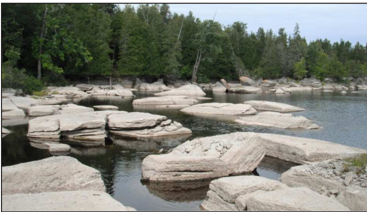
Figure 1. Dallages calcaires de l'île Fitzpatrick.

De plus, les trouvailles botaniques exceptionnelles continuent d'affluer à chaque année, le territoire étant très vaste, et les botanistes explorant la région se faisant plutôt rares. En conséquence, encore plusieurs découvertes intéressantes restent à faire dans cette partie occidentale du domaine de l'érablière laurentienne.