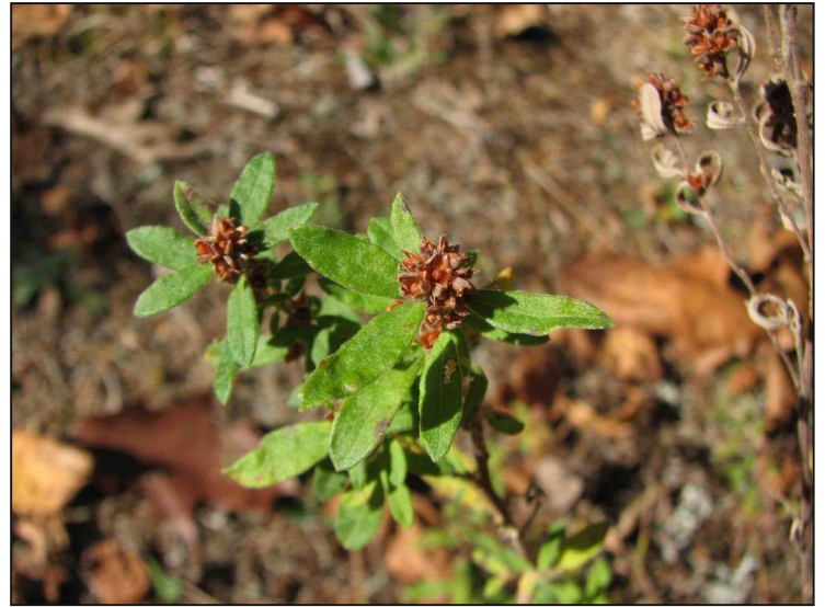
Figure 2 : L'hélianthème du Canada ( Crocanthemum canadense ) en fruits.

Par la suite, un peu à l'ouest de la localité de Weirstead, nous avons herborisé dans un vaste complexe dunaire, variant de partiellement à complètement ouvert et même parfois avec de vastes étendues de sable à nu. Les secteurs forestiers étaient dominés par le pin blanc, le chêne rouge, l'épinette blanche, le bouleau à papier et le pin sylvestre. La première observation d'importance fut la découverte d'une autre petite population de botryche à limbe rugueux ( Botrychium rugulosum W. H. Wagner), ici 12 individus dispersés sur 30 x 2 m. Cette petite fougère ressemble, dans sa partie végétative