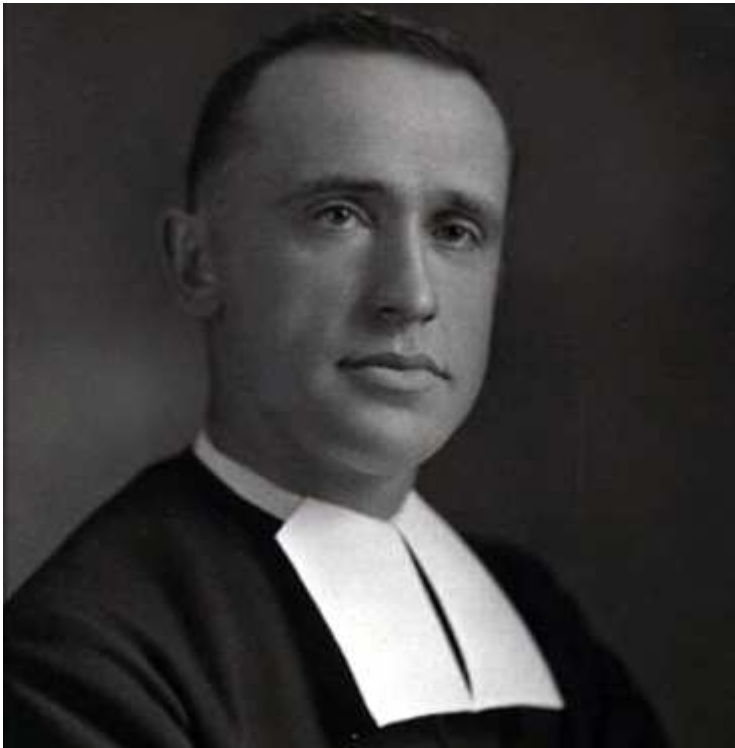
Figure 1 : Marie-Victorin lors de ses premières années à l'Université de Montréal, vers 1922-1923.

expéditions ailleurs dans le monde; la fondation de l'Institut de botanique, du Jardin botanique de Montréal, etc. Sans oublier, bien sûr, l'épopée de la Flore laurentienne.