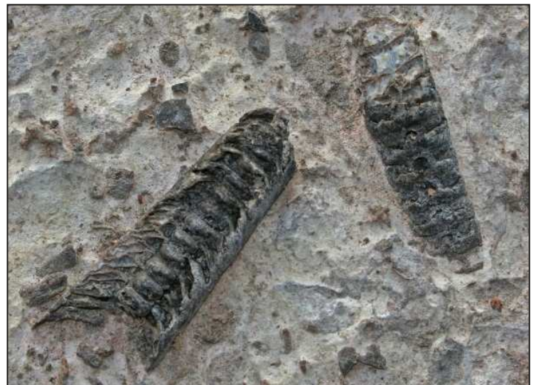
Figure 2. Fossiles dans le calcaire de l'île Fitzpatrick.

Une autre particularité impressionnante de ces rives, qui est apparemment très rare dans toute la province; les deux