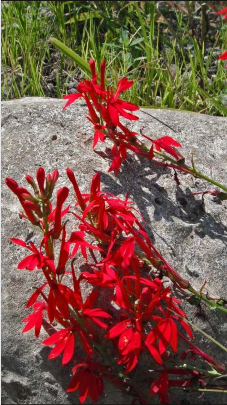
Figure 6. La lobélie cardinale, Lobelia cardinalis . Photo de Philippe Blais.

est dominée par des individus du Dirca palustris Linnaeus dont les branches grossièrement tronquées témoignent du broutage intensif du cerf de Virginie, phénomène qui affecte d'ailleurs plusieurs autres plantes de ces îles. On y retrouve aussi le Carpinus caroliniana Walter et l' Ostrya virginiana (Miller) K. Koch.