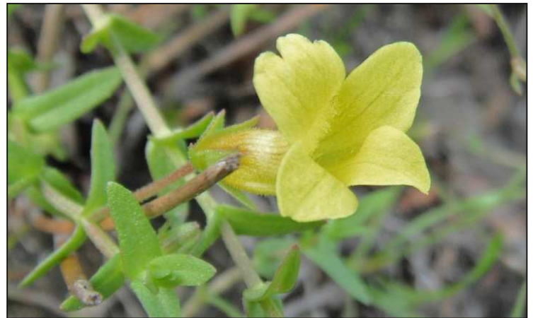
Figure 4. La gratiole dorée ( Gratiola aurea ).

nettement plus humides et ombragés que les versants Ouest, et toute la section mitoyenne de l'île Fitzpatrick abrite une cédrière humide sur dallage calcaire. La strate arbustive du sous-bois du centre-sud de l'île Fitzpatrick est si clairsemée qu'on la croirait aménagée et de multiples chicots et de grand arbres morts jonchent le sol, forçant souvent le randonneur à de grandes enjambées et suggérant la présence d'une forêt ancienne.