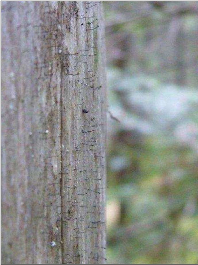
Figure 3. Lichen tête d'épingle du genre Calicium sur le tronc mort d'un sapin.