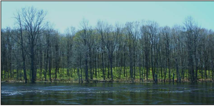
Figure 3. Érablière de l'île Reid, fin avril.

îles, et particulièrement l'île Fitzpatrick, sont minées par des chenaux souterrains! Des piles de troncs d'arbres et autres débris flottants s'amoncellent aux endroits où le courant s'engouffre sous la rive, et le plancher même des îles, excavé par l'effet de l'eau, s'est effondré à plusieurs endroits en pleine forêt. On peut même observer des bancs de petits poissons évoluer à contre-courant dans deux « marmites » ainsi formées au beau milieu de la forêt de l'Île Reid! Il faut le voir pour le croire.