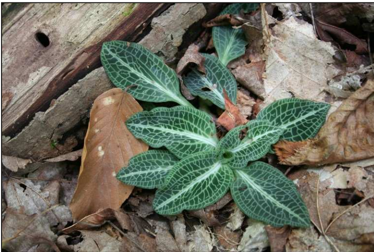
Figure 5. La goodyérie pubescente ( Goodyera pubescens ).

Les qualités hydro-géologiques spectaculaires de ces îles ne peuvent rivaliser qu'avec celles de leur flore. Malgré leurs surfaces relativement petites, les types de forêts y sont étonnamment variés. L'érablière à érable à sucre domine leurs centres, mais les pointes sud et les rives ouest sont bordées de pins blancs de grande taille et de thuyas. Une hêtraie domine le sud de l'île Reid. Les versants Est de ces deux îles sont