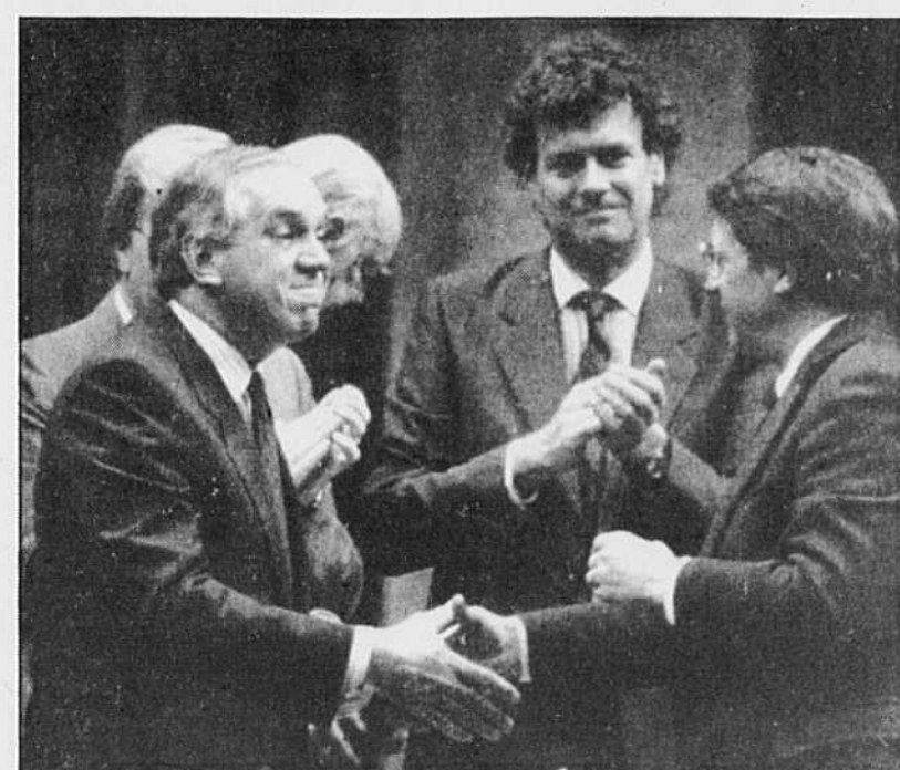
Ed Broadbent a été applaudi par ses collègues et félicité par le libéral Lloyd Axworthy lors de son dernier discours aux Communes.