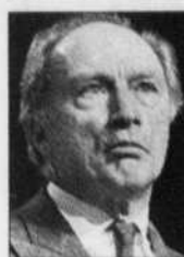
Pierre Elliott Trudeau

Je l'ai connu comme condisciple et ami tout au long de mes études, depuis l'âge de dix ans jusqu'à 22 ans. Il était à peu près chaque année dans ma classe. Plus tard, je l'ai revu des quantités de fois. Je suis donc bien placé pour apporter un éclairage différent à son sujet.