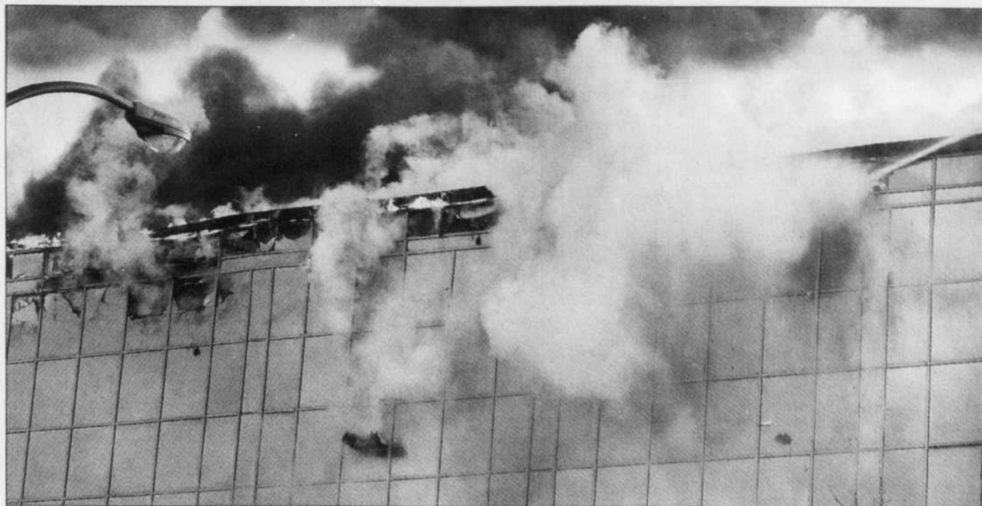
Si l'imposant brasier est resté confiné au toit de l'édifice Henri-Julien de l'Université du Québec, l'eau a provoqué beaucoup de dégâts à l'intérieur, a fait savoir la direction des communications en fin de journée. L'immeuble sera fermé jusqu'à nouvel ordre.

À l'arrivée des pompiers, le feu avait déjà gagné toute la surface du toit. Ceux-ci ont rapidement dû se replier au cinquième étage en raison de l'appel d'air qui s'était créé dans l'entre-toit. Chauffé à blanc, le toit menaçait alors de s'effondrer. Les choses étaient