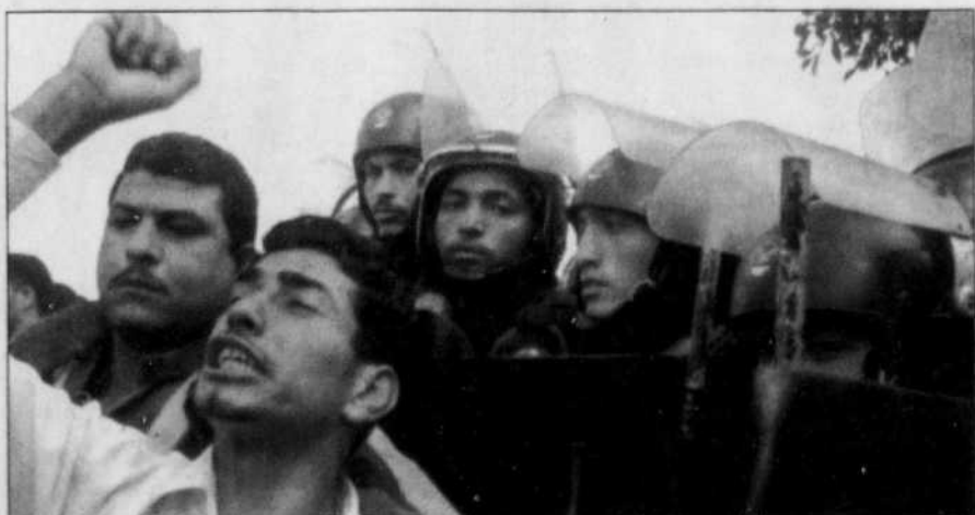
Les policiers entravent l'accès aux bureaux de vote dans des circonscriptions clés.