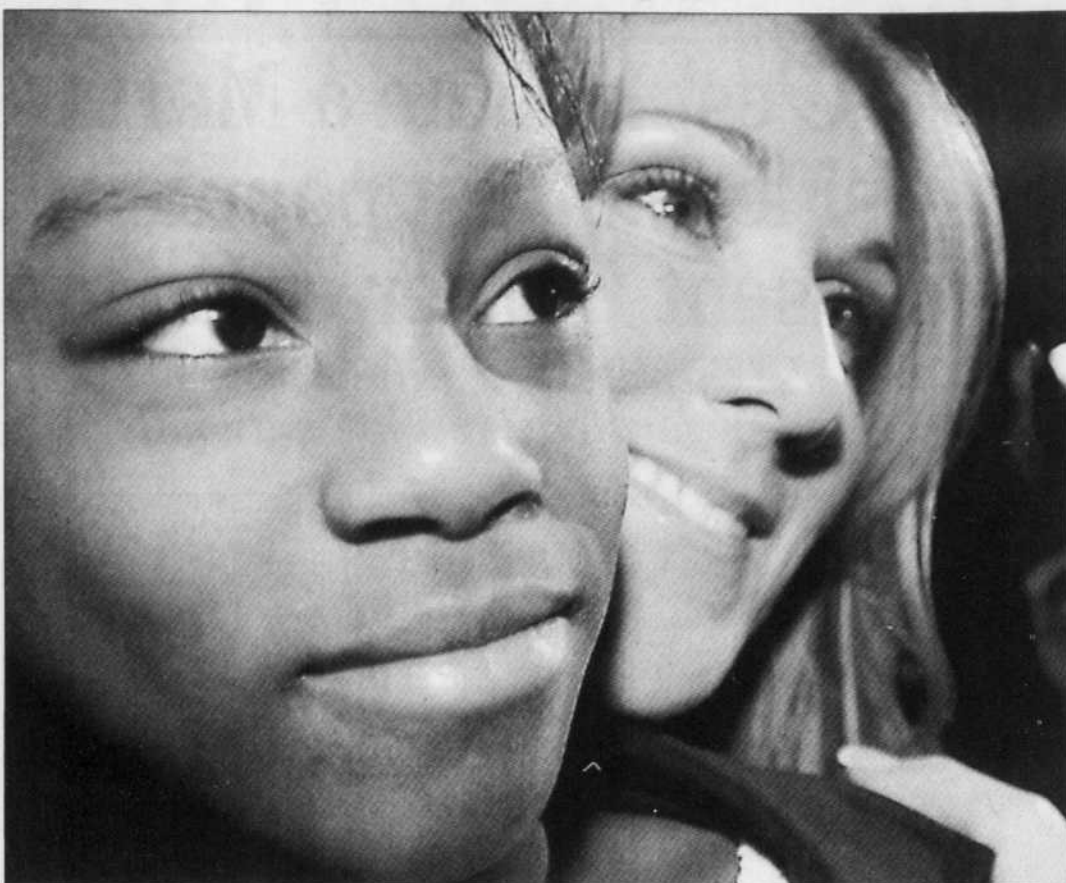
ANNIK MH DE CARUPEL LE DEVOIR

LA FONDATION de l'hôpital Sainte-Justine a annoncé hier avoir réussi à récolter la rondelette somme de 125,4 millions dans le cadre de sa campagne de financement «Grandir en santé». Lancée en décembre 2002 pour permettre à l'hôpital pédiatrique de recueillir 100 des 400 millions nécessaires pour développer le Centre mère-enfant, la campagne, qui était parrainée par le couple Céline Dion et René Angélil, a dépassé de loin son objectif. Plus de 55 de ces millions proviennent du grand public, 28 millions de fondations, 27 millions d'entreprises et près de 15 millions de dons individuels. Le directeur général de Sainte-Justine, le Dr Khim Dao, a annoncé que ces sommes serviront à agrandir le Centre de cancérologie Charles-Bruneau, et à construire des unités spécialisées, un nouveau centre de recherche ainsi qu'un tout nouveau pavillon destiné à l'enseignement.