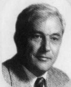
Willard Boyle (1924 - ) Génie physique Il a inventé le dispositif à couplage de charges (DCC) qui a mené à la conception de l'appareil photo numérique, grâce auquel les astronomes ont redéfini notre connaissance de l'Univers.