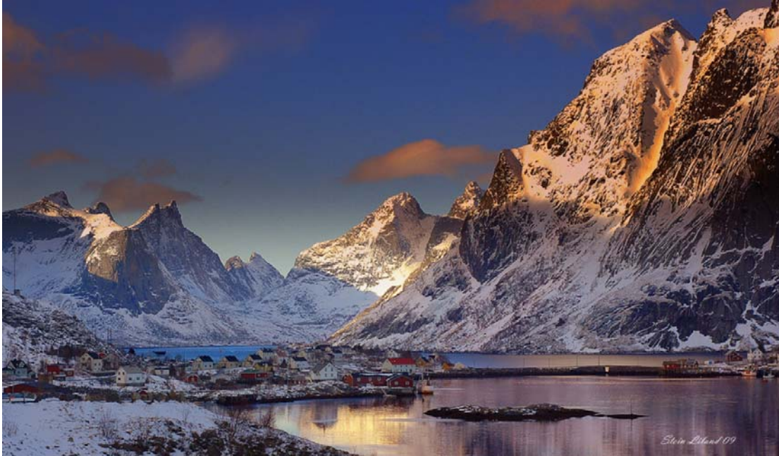
Grandeur nature : diaporama des îles Lofoten en Norvège