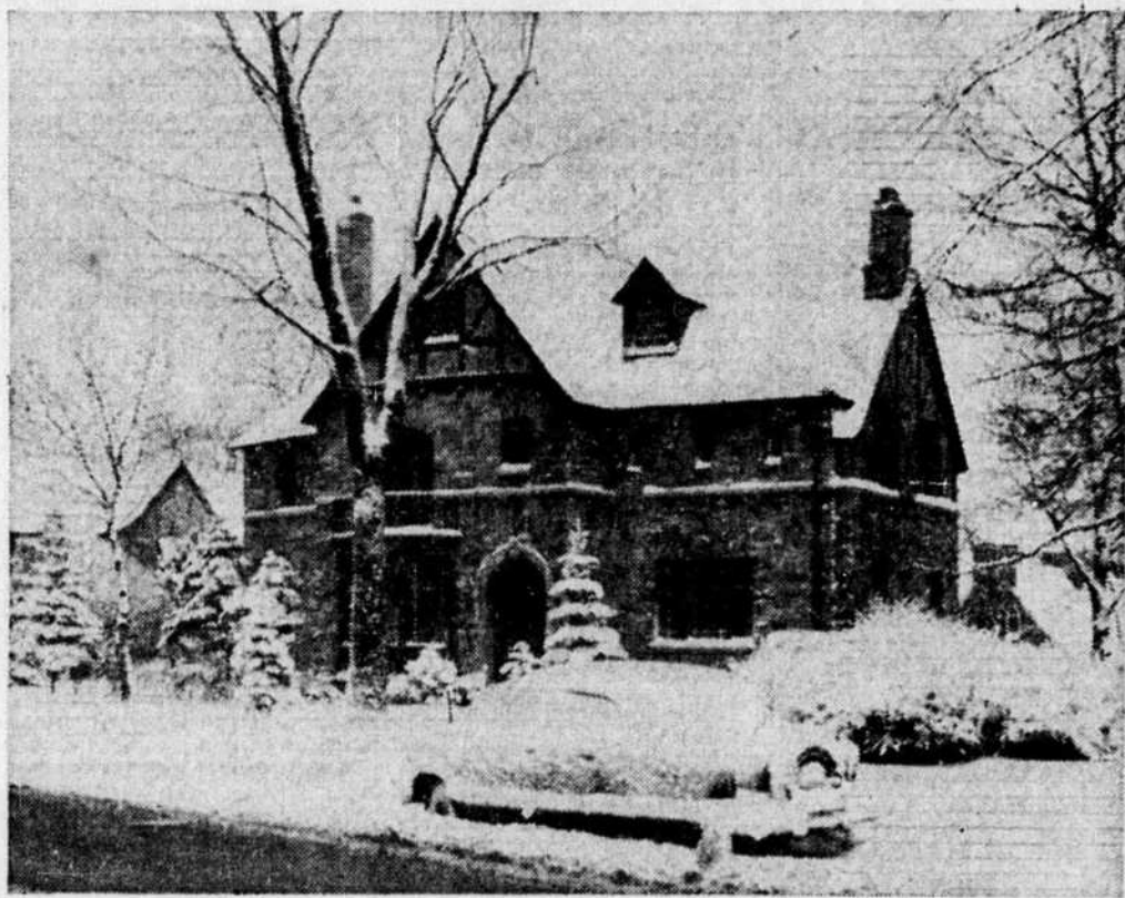
Quand même... Si beaucoup d'automobilistes et de piétons ont maugréé contre les neiges des derniers jours, il est quand même des coins de la métropole où la neige n'a rien perdu de sa poésie et de son charme. Le propriétaire de cette automobile a probablement refusé d'utiliser son véhicule, hier matin, afin de ne rien masquer aux décors de la rue des Cèdres, à Westmount.

LA POLITIQUE DE PARTIS M. Saulnier a ajouté que ce caucus démontrerait que l'administration Savignac ne désire aucunement abandonner la politique de partis à l'hôtel de ville comme on a voulu le laisser entendre durant la campagne électorale et après les élections.