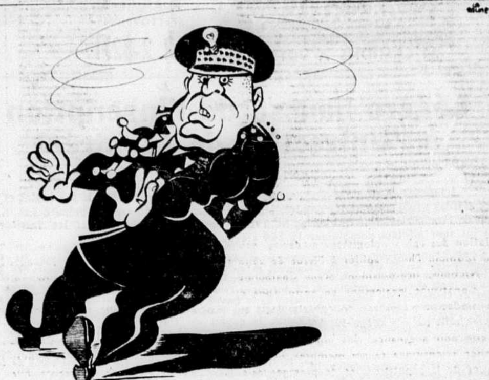
Langlois: "Whoa! j'veins de comprendre la déclaration du cardinal"

Une situation confuse Il est également hors de doute que si elles pouvaient faire bloc