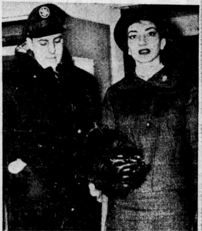
La fameuse cantatrice Maria Callas, photographée hier à Dorval à l'escalade de l'avion d'Air-France à bord duquel elle se rendait à Chicago. Mme Callas s'est déclarée enchantée de son court arrêt à Montréal et a exprimé le souhait d'y revenir pour un laps de temps plus long. On sait que Mme Callas a causé récemment tout un émoi à l'Opéra de Rome où elle s'arrêtait de chanter à la fin du premier acte de "Norma". L'événement prit de l'ampleur du fait qu'il se produisit à une soirée de gala à laquelle assistait le président de la République. Elle a affirmé qu'elle souffrait d'un mal de gorge alors que la critique italienne a prétendu qu'elle avait été vexée du peu d'enthousiasme manifesté par le public.

On prévoit que les syndicats se heurteront à des difficultés considérables au cours des négociations. Des maintenant, les observateurs sont d'avis que la première phase des demandes économiques s'accompagnera d'un affaiblissement de la livre sterling. Toute augmentation, soulignent-ils, devra être justifiée par un accroissement du rendement et de la production.