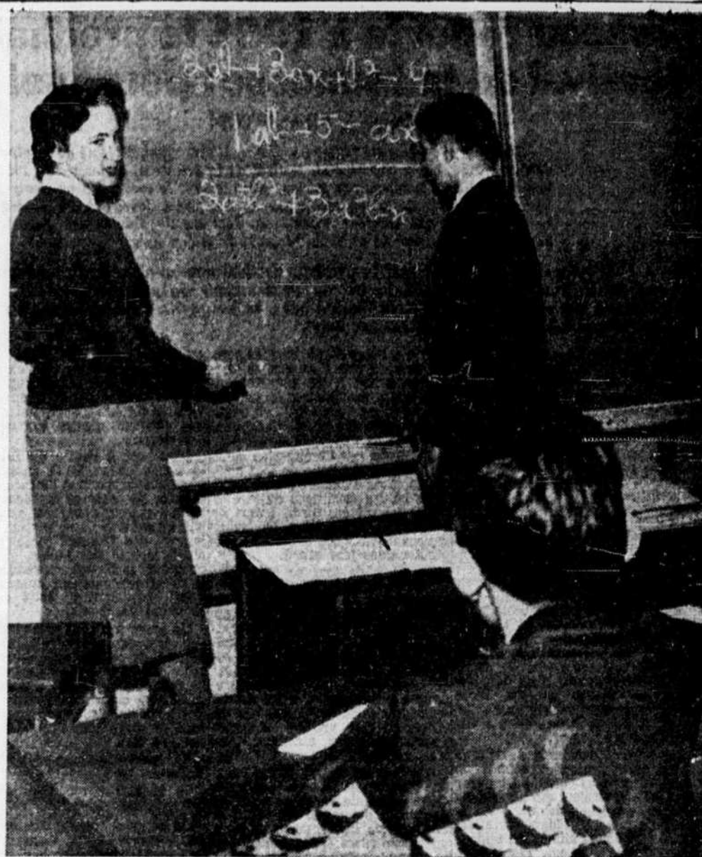
Classe d'algèbre au Collège Saint-Denis. — Le Comité féminin de ce collège organise un buffet-modes pour le 11 février au Centre social de l'Université de Montréal. Le Collège Saint-Denis est la seule institution catholique d'enseignement classique dans la province qui soit dirigée par des laïcs. Cette institution est affiliée à l'Université de Montréal, faculté des Arts.