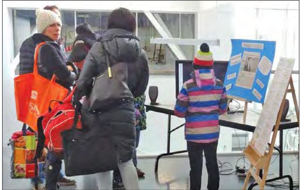
L'événement de l'Opération Tendre la main (OTM) a été un succès immense lors des précédentes éditions.

Les femmes désireuses de joindre les rangs de l'Afeas de Saint-Augustin peuvent le faire en tout temps. Le coût de la cotisation annuelle est de 35 $. Les intéressées peuvent consulter la page Facebook de l'association. ■