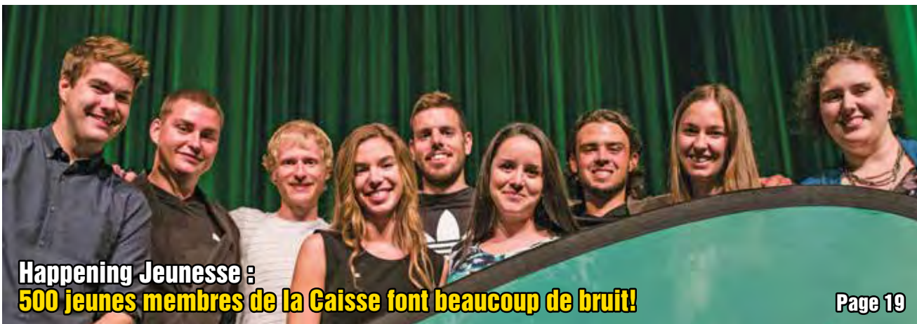
Happening Jeunesse : 500 jeunes membres de la Caisse font beaucoup de bruit!