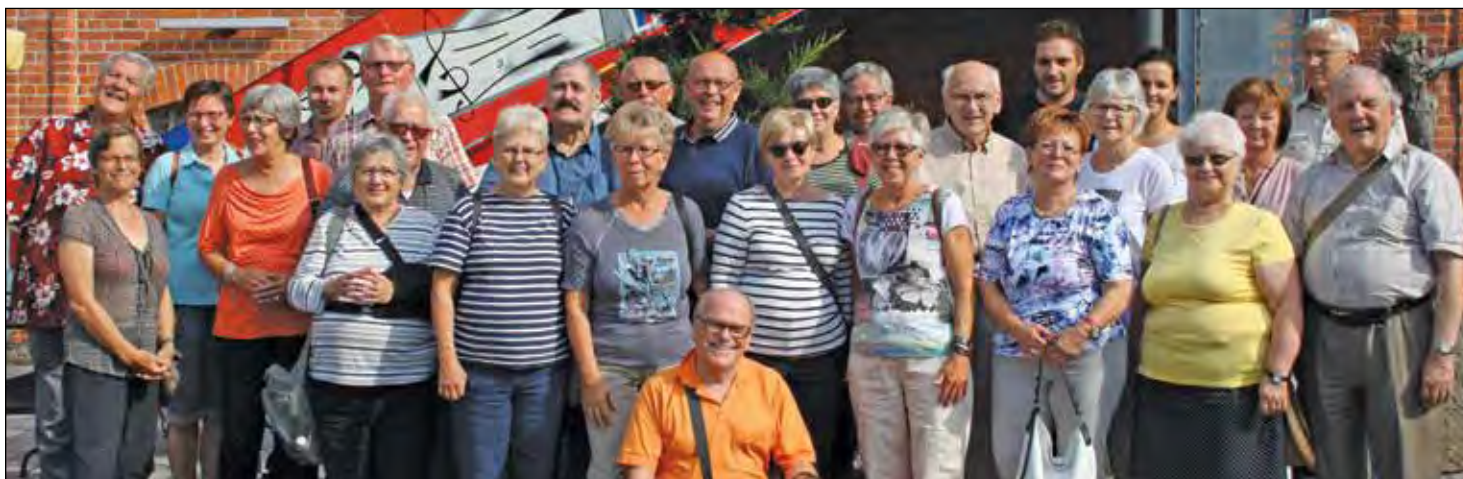
L'ensemble des membres qui ont participé à cette expédition en Allemagne, en compagnie de leurs amis Français, Allemands et Polonais à l'été 2017 devant la mairie de Langewiesen.

La célébration des 25 ans du jumelage des Carougeois a eu lieu auprès des Français de Chauray, en compagnie de leurs propres jumeaux de Schöffengrund et Langewiesen, en Allemagne. Au mois d'août dernier, les autres membres des pays européens ont fait vivre aux membres de l'Association des moments riches et inoubliables tout en