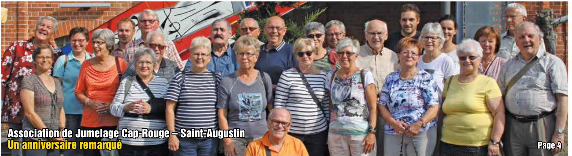
Association de Jumelage Cap-Rouge – Saint-Augustin Un anniversaire remarqué