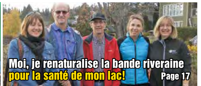
Moi, je renaturalise la bande riveraine pour la santé de mon lac!