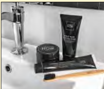
Les produits Charbon Noir

La tendance aux produits à base de Charbon activé bat son plein, et la jeune entreprise québécoise Charbon Noir, implantée à Québec, fait déjà sa place ici et ailleurs grâce à ses produits uniques! Créée il y a tout juste six mois, Charbon Noir connaît déjà de nombreux adeptes au Canada, aux États-Unis et même en Europe pour sa gamme de produits naturels à base de charbon. Uniques, les produits Charbon Noir sont fabriqués à partir de coques de noix de coco et sont donc fièrement créés de façon écoresponsable, végane et sont non-testés sur les animaux. Au printemps dernier, après seulement 90 jours d'existence, CHARBON NOIR a réussi à générer plus de 100 000 $ de ventes de son coffret de produits (vendu à 73,99$ + taxes).