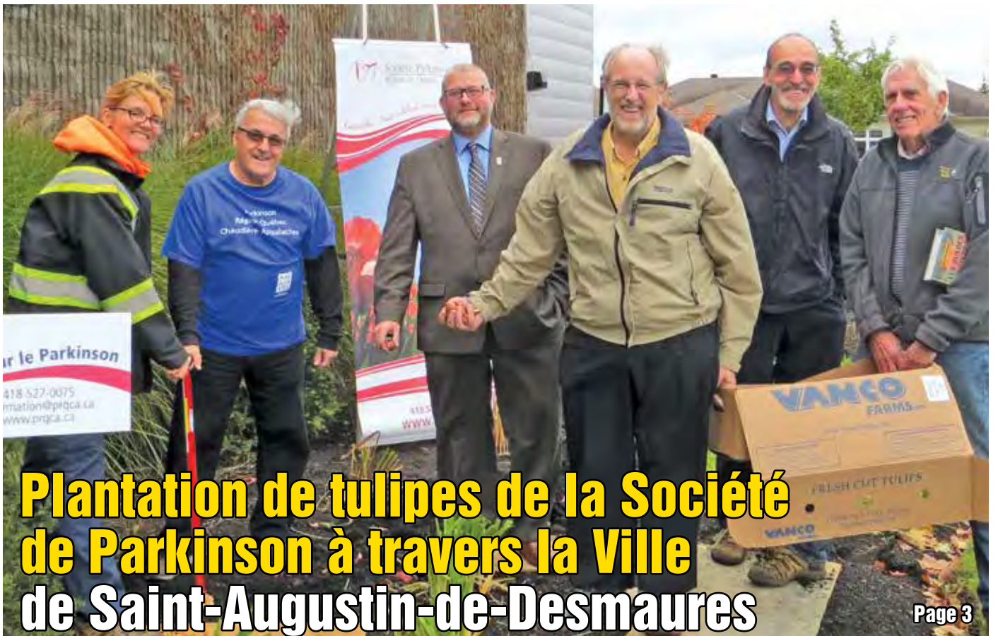
Plantation de tulipes de la Société de Parkinson à travers la Ville de Saint-Augustin-de-Desmaures