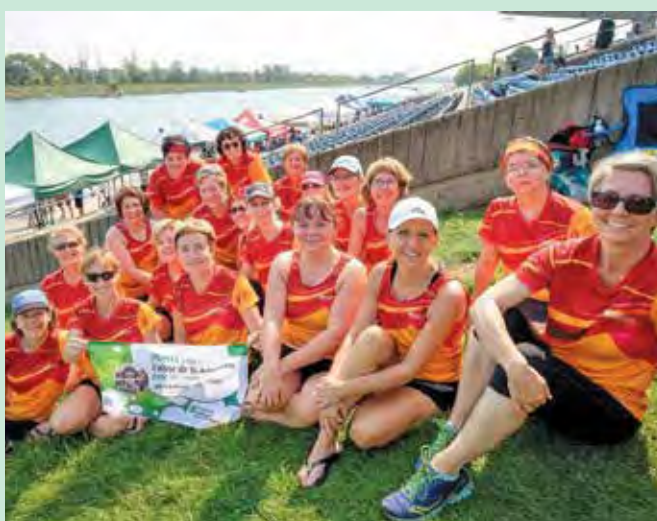
L'équipe de bateau dragon Vise-à-Vie lors de leur dernière compétition de la saison 2017, au bassin olympique du parc Jean-Drapeau à Montréal.

Vise-à-Vie est composée uniquement de survivants et survivantes du cancer du sein et représente la région de Québec dans les compétitions régionales, nationales et internationales. En 2018, l'équipe se rendra à Florence, en Italie, pour participer au 5 e Festival international de bateau dragon pour survivants et survivantes du cancer du sein. Nous sommes fiers de souligner la détermination de toute l'équipe, dont deux rameuses membres de la Caisse.