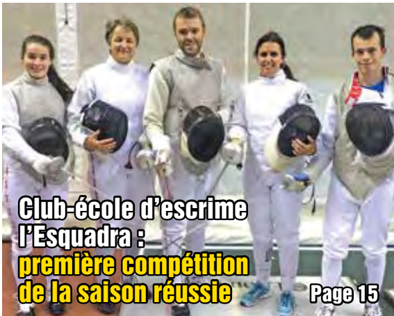
Club-école d'escrime l'Esquadra : première compétition de la saison réussie