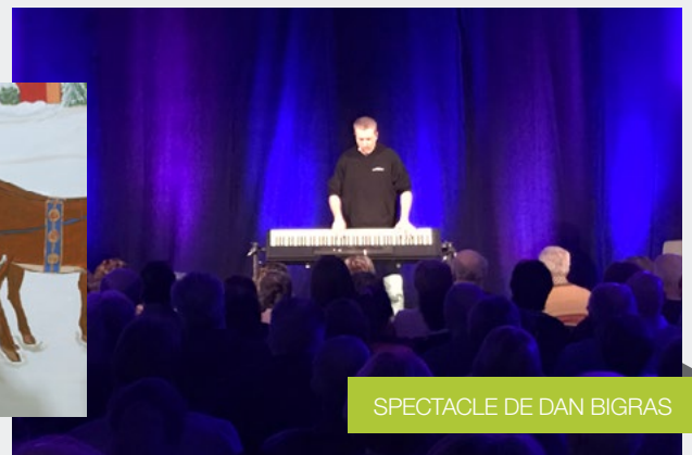
SPECTACLE DE DAN BIGRAS