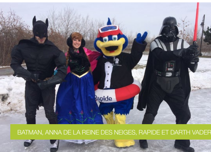
BATMAN, ANNA DE LA REINE DES NEIGES, RAPIDE ET DARTH VADER

Rapide a chaussé ses patins et s'est rendu sur le sentier glacé pour accueillir les jeunes patineurs dans le cadre des premiers Rendez-vous polaires.