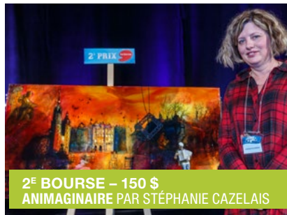
2 È BOURSE – 150 $ ANIMAGINAIRE PAR STÉPHANIE CAZELAIS