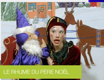
LE RHUME DU PÈRE NOËL

Le spectacle jeunesse « Le rhume du Père Noël » et le spectacle de Dan Bigras , tous deux donnés à guichet fermé, ont fait la joie d'un public conquis.