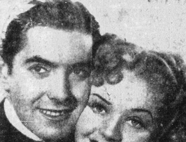
TYRONE POWER et ALICE FAYE, reviendront au Capitol les quatre premiers jours de la semaine, dans "Rose of Washington Square".