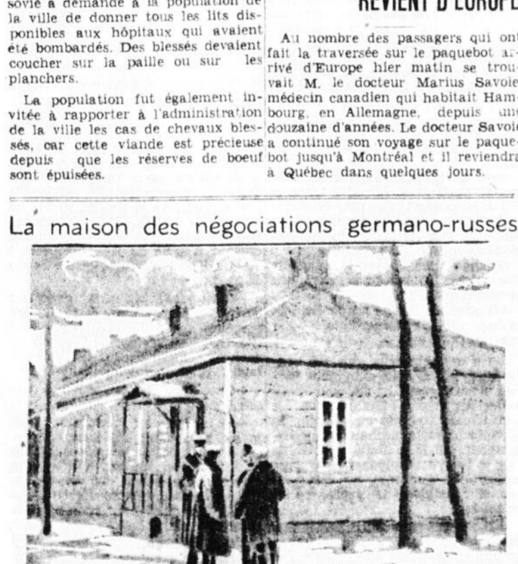
C'est dans cette maison de Brest-Litovsk qu'eurent lieu les délibérations préliminaires à la capitulation de la Russie lors de la Grande Guerre. Lundi les représentants de ce pays et de l'Allemagne se rencontraient de nouveau à Brest-Litovsk pour consommer le démembrement de la Pologne déjà ourdi dans les officines germano-russes.