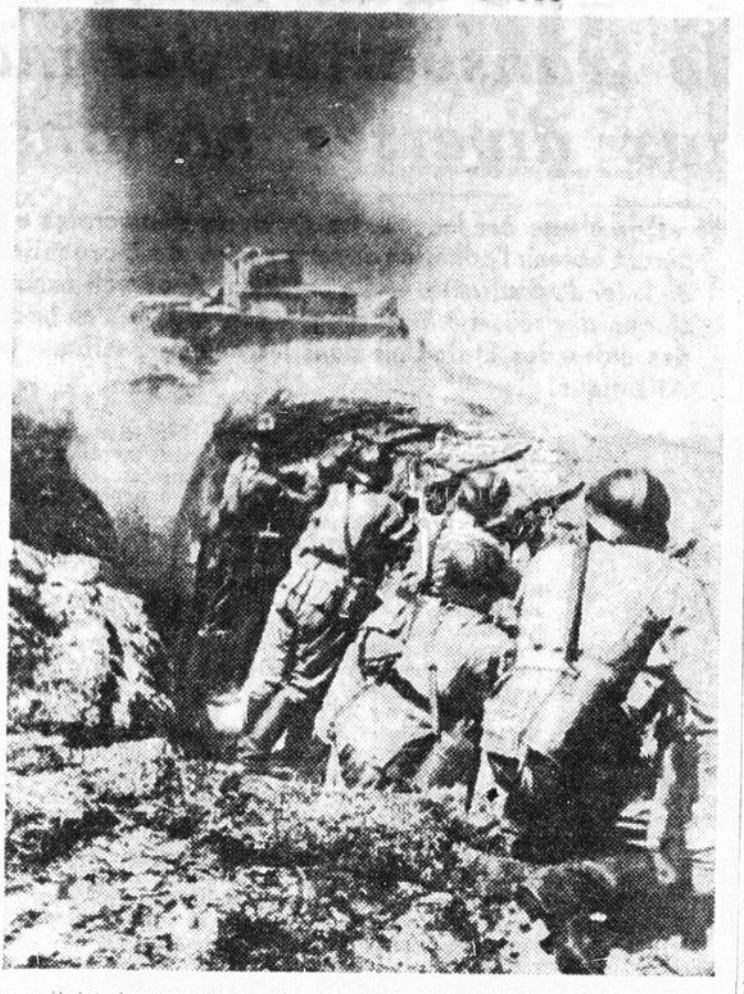
On voit ici des troupes polonaises combattant, "quelque part en Pologne", contre un ennemi infiniment supérieur en nombre.