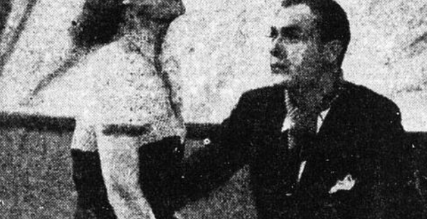
IRENE DUNNE et CHARLES BOYER, les vedettes du film Universal "When Tomorrow Comes".