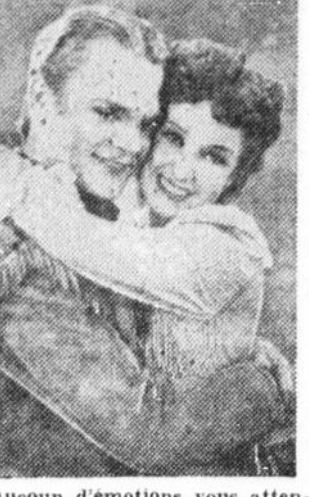
Beaucoup d'émotions vous attendent dans le film "THE OKLAHOMA KID" avec James Cagney et Rosemary Lane, au Princesse commençant aujourd'hui.