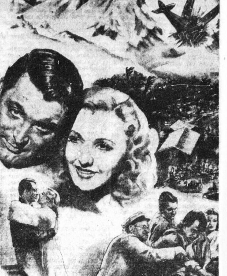
Cette photo illustre quelques scènes du film ONLY ANGELS HAVE WINGS dont les principaux interprètes sont Jean Arthur, Gary Grant et Richard Barthelmess et que l'Empire présente en première comment aujourd'hui.