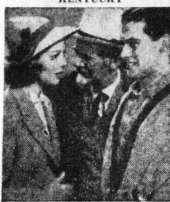
LORETTA YOUNG et RICHARD GREENE dans le beau film en couleurs "KENTUCKY", à l'affiche du Cinéma de Lévis aujourd'hui.