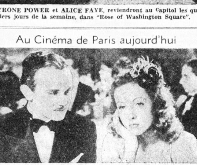
PIERRE DAX et DANIELLE DARRIEUX dans une scène tirée du film "Retour à l'aube" qui prend l'affiche aujourd'hui au Cinéma de Paris, en programme double.