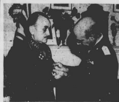
Nel salone dell'ambasciatata, il capo di stato Maggiore italiano General Marras, appunta la Medaglia Italiana al Valor Militare al petto del Gen. Foulka, capo di stato maggiore canadese.

della provvidenza, degli Stati Uniti e del Canada è risorta.