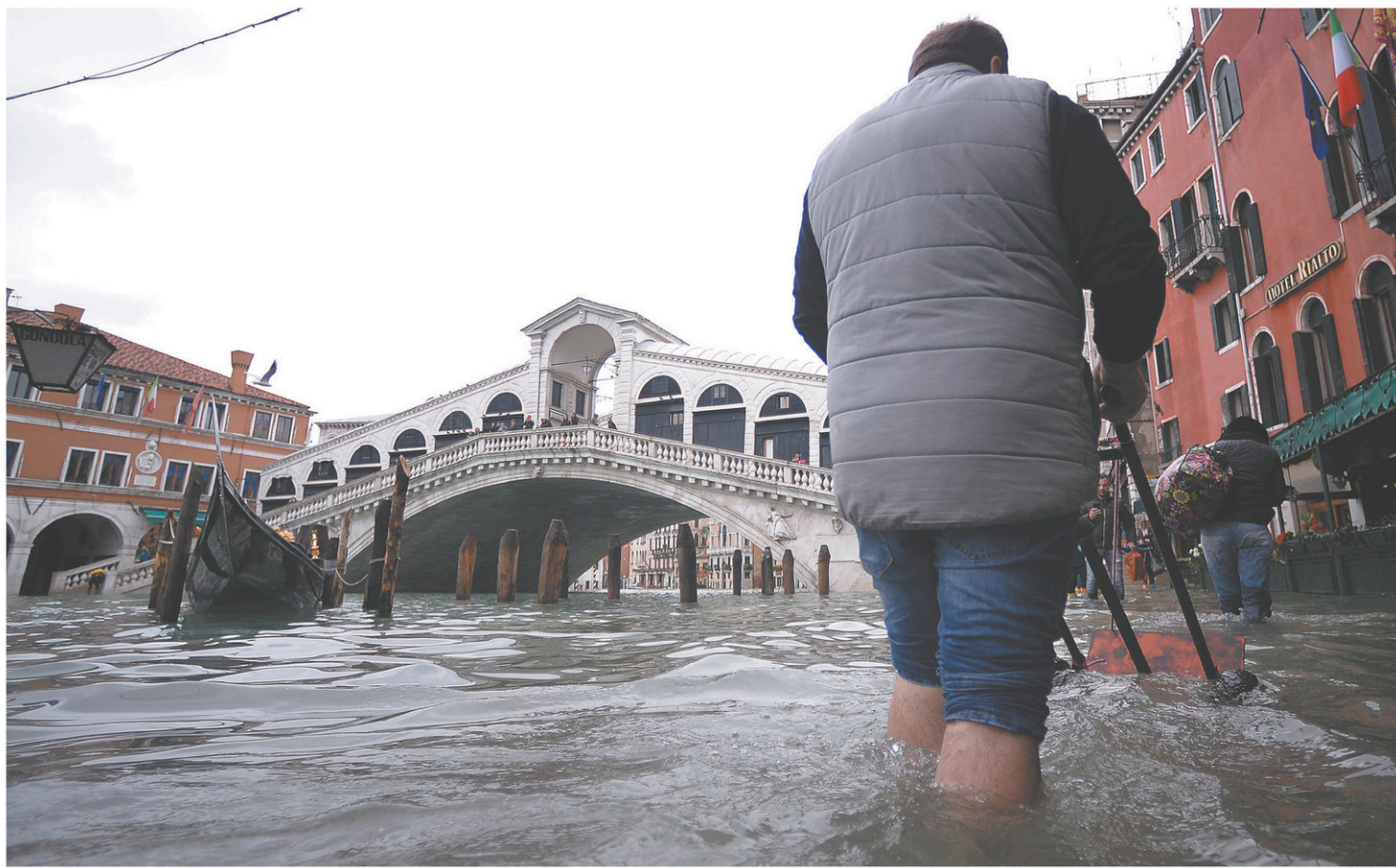
Un homme poussait un chariot dans une rue inondée de Venise, à proximité du pont du Rialto.