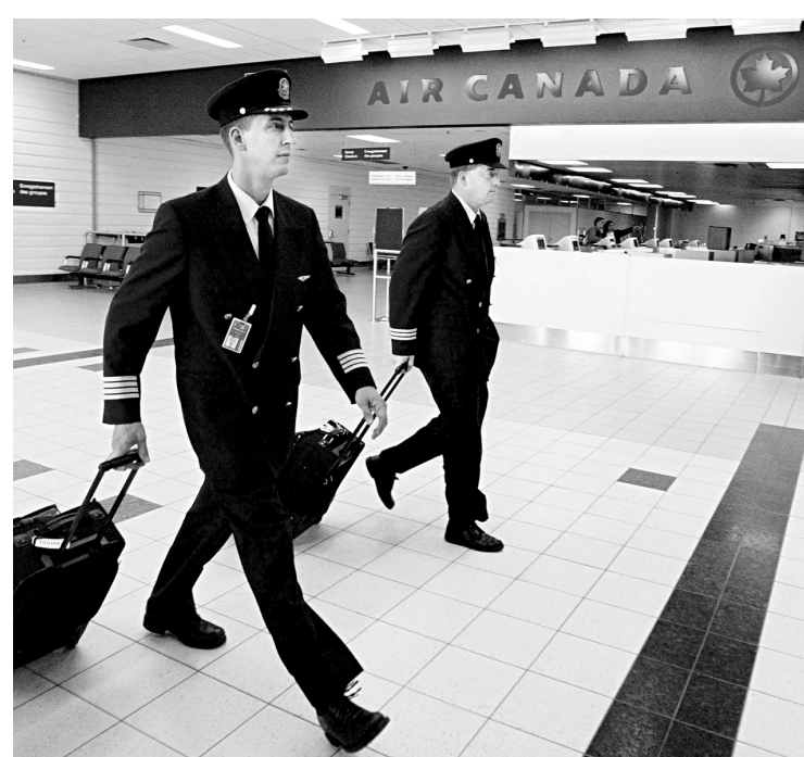
ANDREW WALLACE REUTERS

La convention collective contient une obligation contractuelle pour les pilotes d'Air Canada de prendre leur retraite à 60 ans.