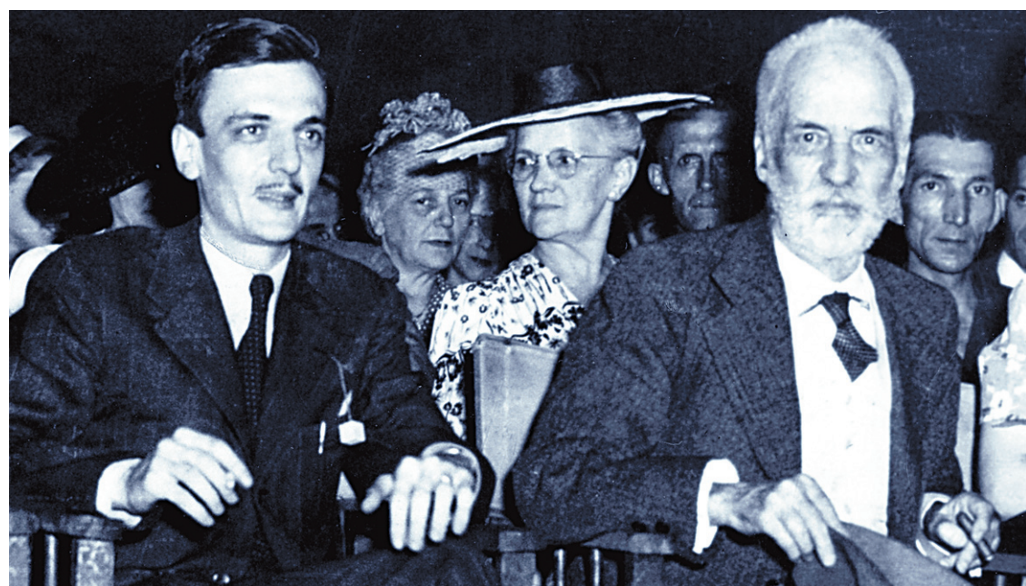
André Laurendeau (à gauche) et Henri Bourassa en 1944

Non seulement m'a-t-il appris les règles de base de l'écriture journalistique, reprenant mes premiers textes et m'indiquant la façon de capter l'attention du lecteur, il m'a également appris la ri-