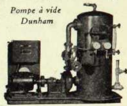
Pompe à vide Dunham

Téléphones : bur. : 2-4256 — rés. : 5277