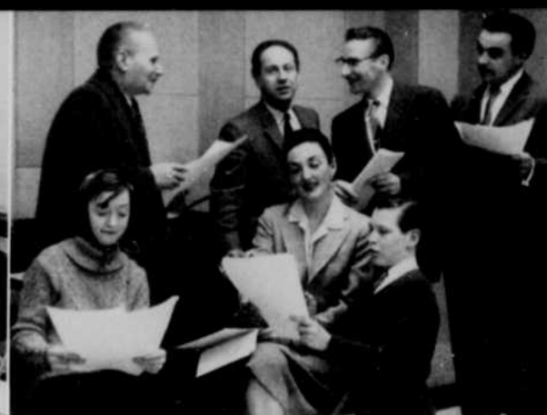
Quelques artisans de "Vies de femmes".