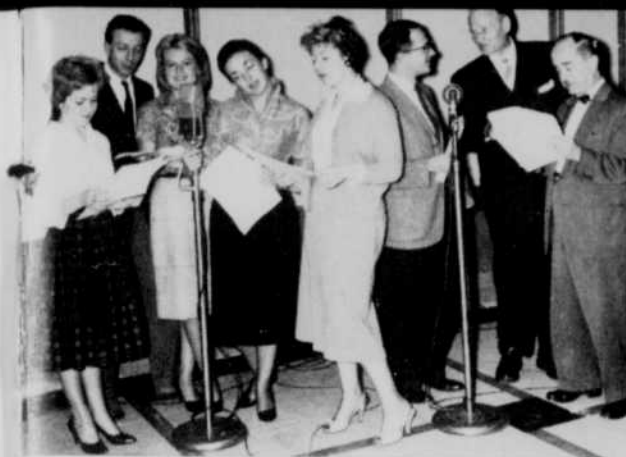
Une répétition pour "Rue Principale".