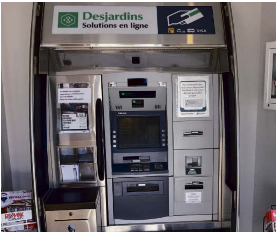
Le guichet automatique Desjardins de Racine, situé dans les locaux de la municipalité, sera officiellement retiré d'ici la fin de l'année.

La pétition pour le maintien du guichet automatique de Racine sera déposée lors de cette assemblée, qui aura lieu le 29 avril, à 18 h 30, au Centre Le Bel Âge de Windsor.