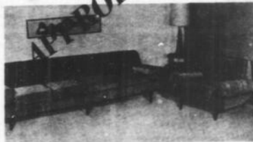
COMPLETO PER SALOTTO