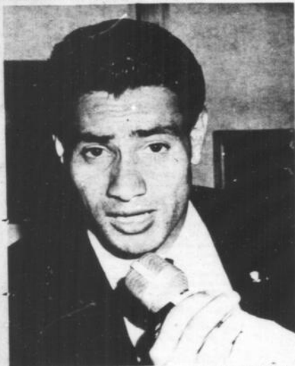
IL CAPITANO ACEVEDO

Inter-Roma, Italia e Hamilton hanno giocato 22 partite; Italica e Toronto C. 21.