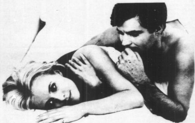
Una inquadratura del film di Agnes Verda, "La Bonheur", interpretato da Jean-Claude Drouot e Marie France Boyer, proiettato in esclusiva alla sala "Resnais" del cinema Elysée. Il soggetto del film, quanto mai audace, non è mai stato prima d'ora affrontato con altrettanta franchezza.