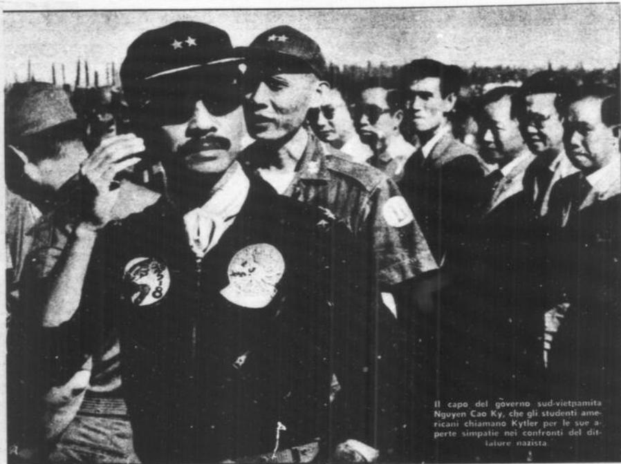
Il capo del governo sud-vietnamita Nguyen Cao Ky, che gli studenti americani chiamano Kytler per le sue aperte simpatie nei confronti del dittatore nazista.