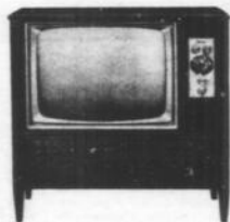
T.V. MARCONI 23" SPECIALE