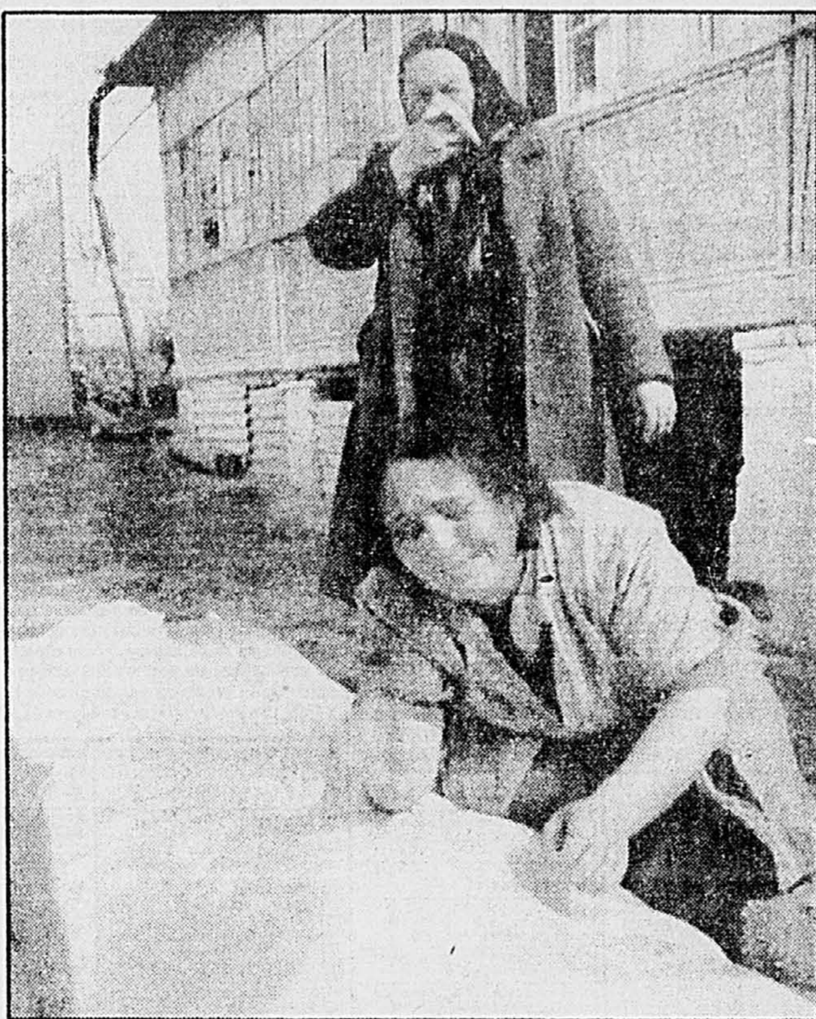
Une femme Azéris pleure la mort de son fils tué lors des affrontements survenus il y a une dizaine de jours avec les Arméniens.

Bakou s'est d'ailleurs dit prêt hier à reconnaître une autonomie locale au Nagorny-Karabakh. Selon le ministre azerbaïdjanais des Affaires étrangères, Hussein Aga Sadykhov, cette autonomie locale pourrait être reconnue à condition que le Nagorny-Karabakh