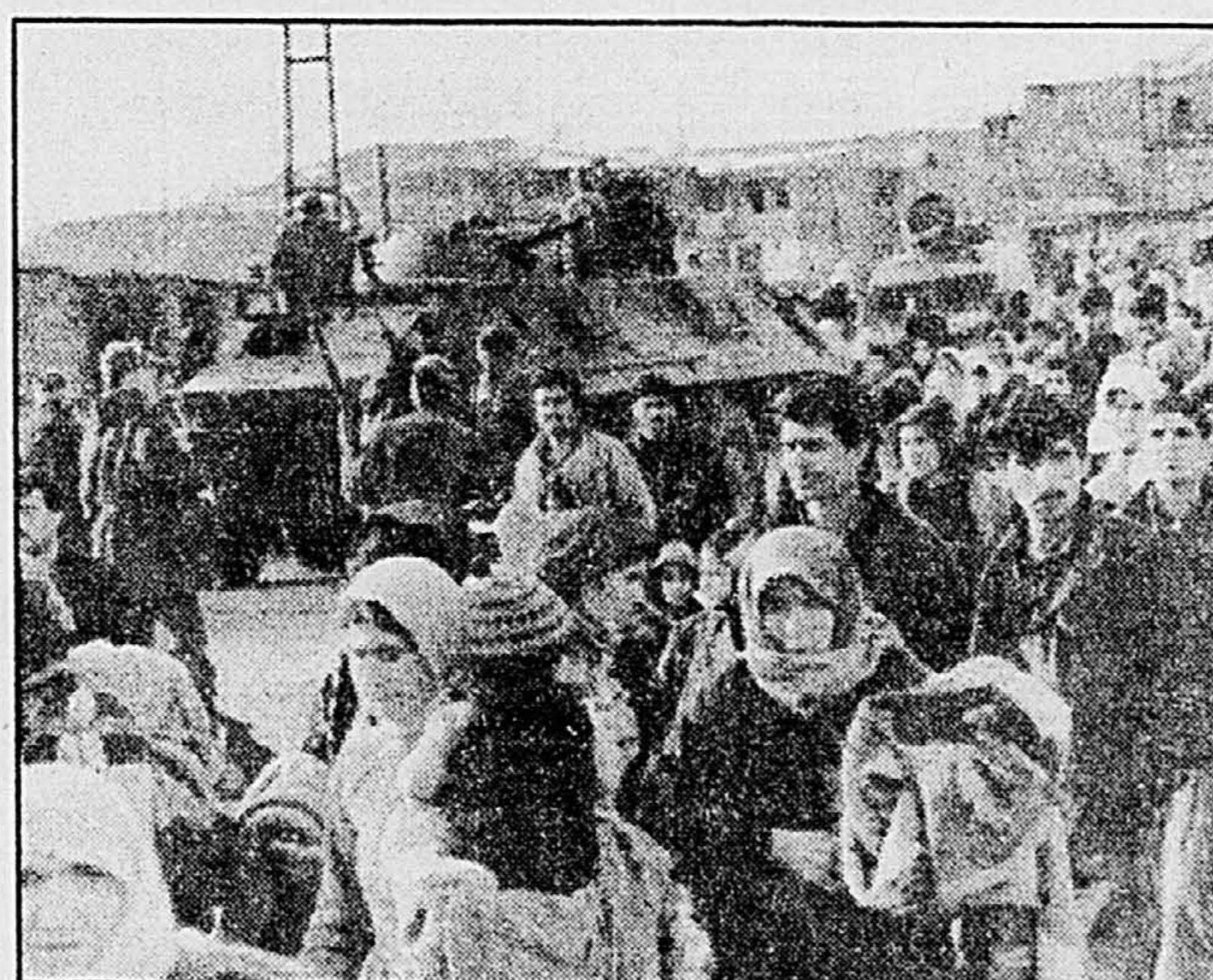
Les soldats turcs ont poursuivi hier leur chasse aux rebelles kurdes à Sirkak, dans le sud-est anatolien.

En début de soirée, l'atmosphère était toujours très tendue à Sirkak, selon des témoins qui ont recueilli par téléphone d'Ankara selon lesquels la ville était fouil-