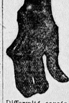
Différents causes par le rhumatisme chronique

Si vous avez le Rhumatisme, laissez-moi vous envoyer une boîte de 50 cents de mon Remède Gratis