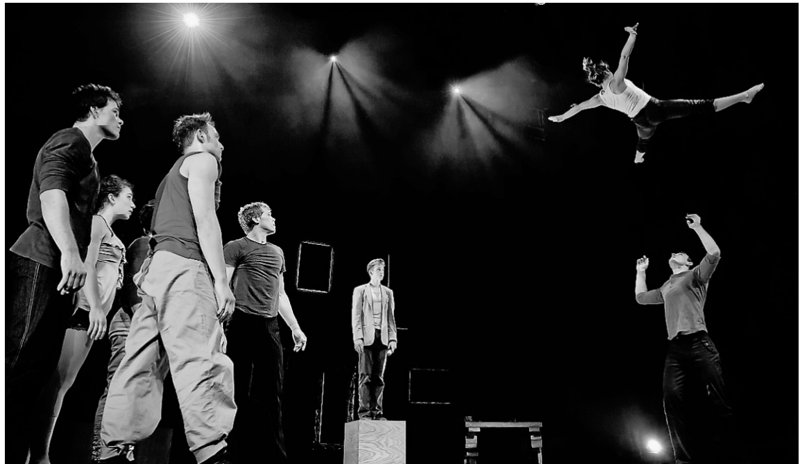
PHOTO ARCHIVES AGENCE FRANCE-PRESSE/MONTRÉAL COMPLÈTEMENT CIRQUE Les spectacles des 7 doigts de la main suscitent l'intérêt de promoteurs partout dans le monde.

Patricia Meerts, programmatrice du Centre culturel Woluwe-Saint-Pierre, à Bruxelles, est une habituée de CINARS depuis 1998.