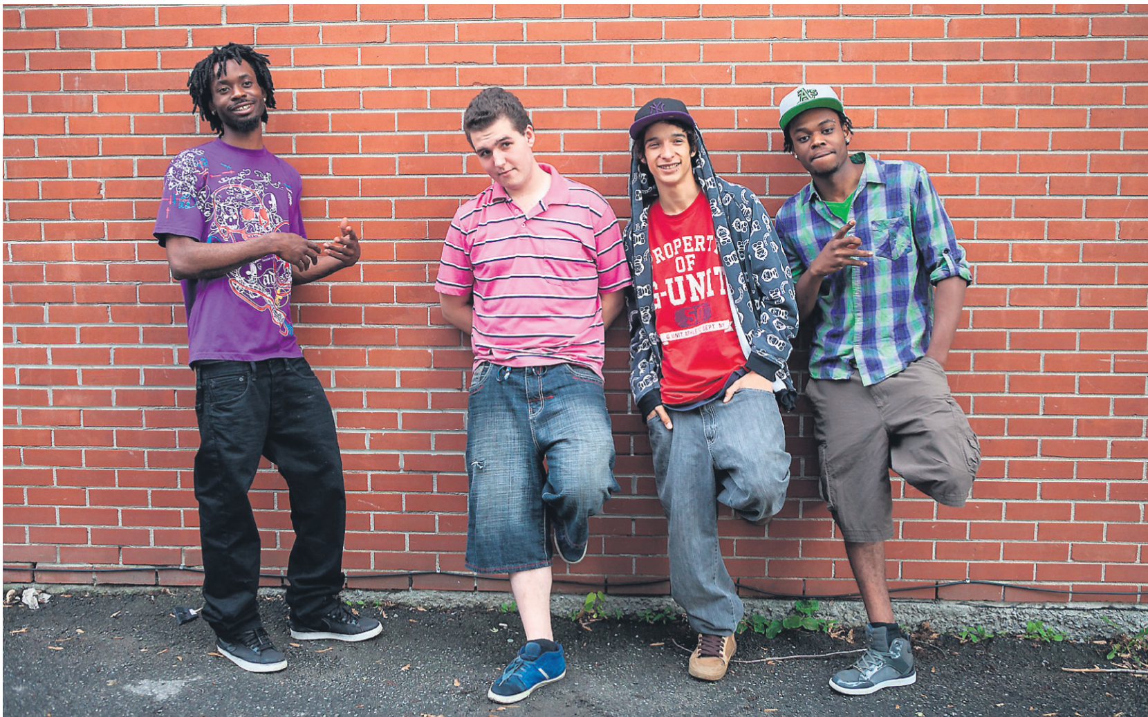
Michael, Danny, Alex et Mikerson, les quatre jeunes de Ma vie réelle , film posthume de Magnus Isacsson.

Ma vie réelle , de Magnus Isacsson, est présenté le 15 novembre à 17h au cinéma Excentris, à l'occasion des RIDM. Il prendra l'affiche le 23 novembre.