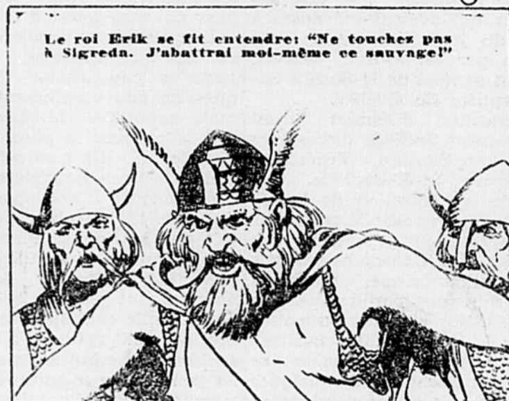
Le roi Erik se fit entendre: "Ne touchez pas à Sigreda. J'abattrais moi-même ce sauvage!"