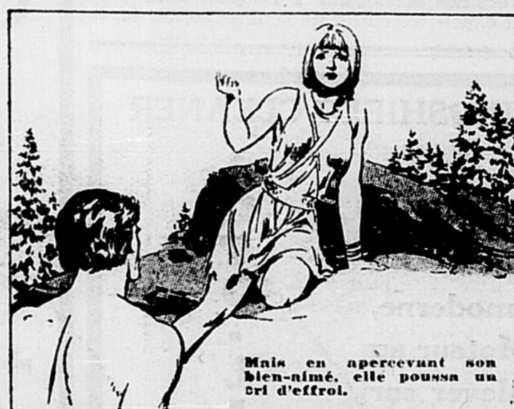
Mais en apercevant son bien-aimé, elle poussa un cri d'effroi.