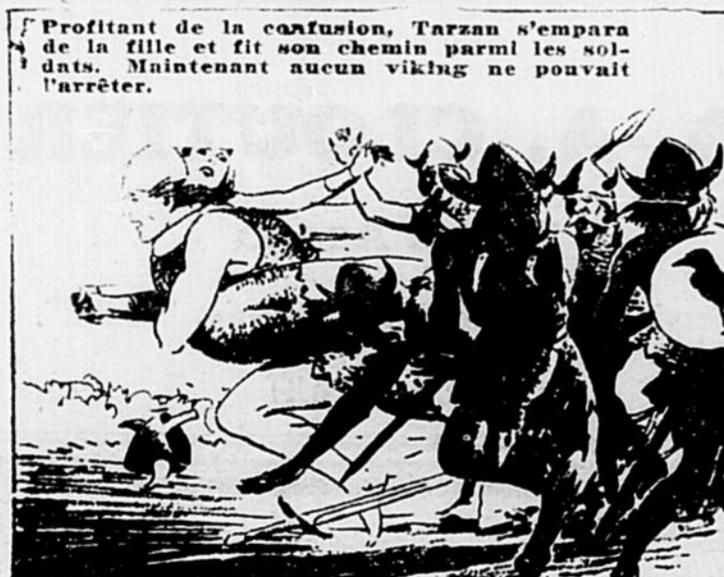
Profitant de la confusion, Tarzan s'empara de la fille et fit son chemin parmi les soldats. Maintenant aucun viking ne pouvait l'arrêter.