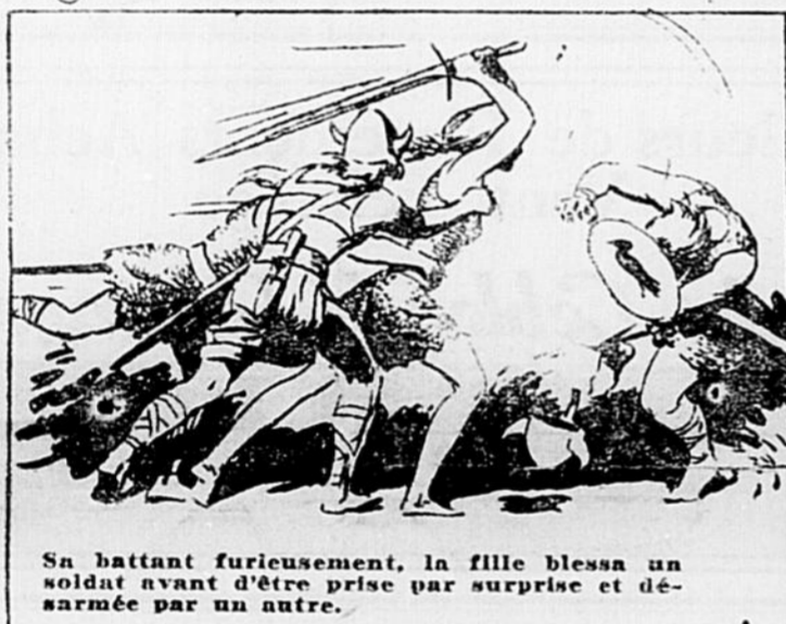
Sa battant furieusement, la fille blessa un soldat avant d'être prise par surprise et désarmée par un autre.