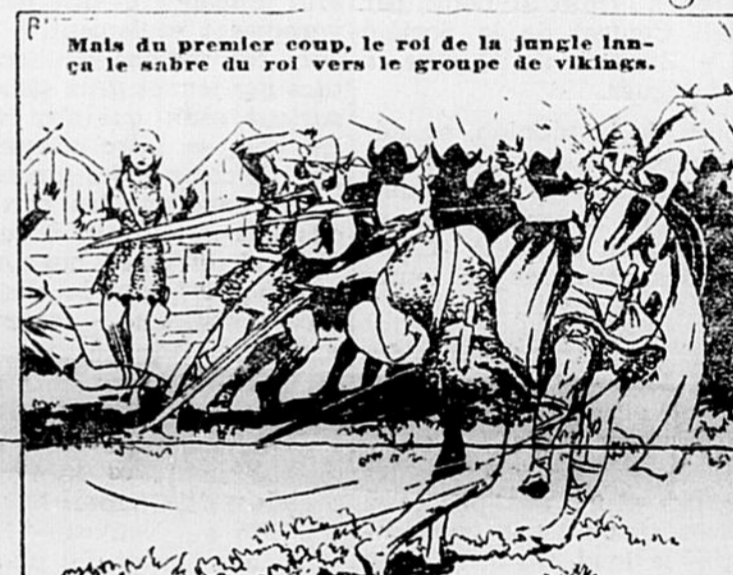
Mais du premier coup, le roi de la jungle lança le sabre du roi vers le groupe de vikings.