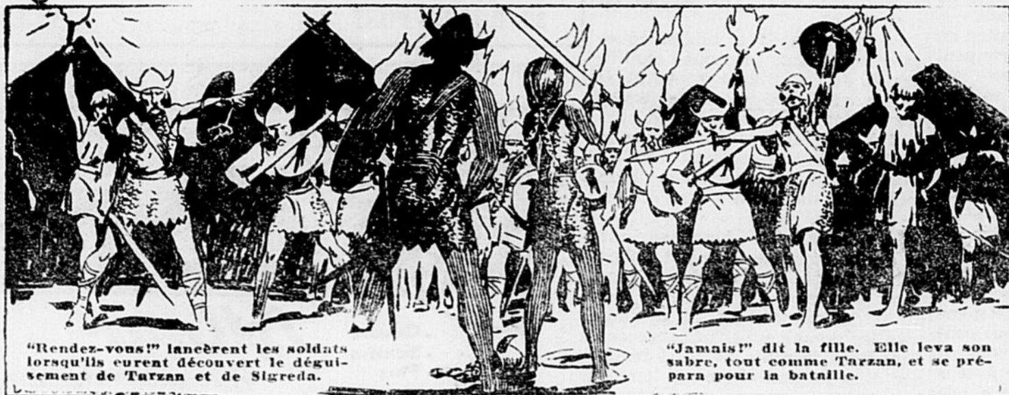
"Rendez-vous!" lancèrent les soldats lorsqu'ils eurent découvert le déguisement de Tarzan et de Sigreda.