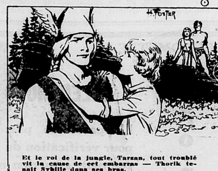
Et le roi de la jungle, Tarzan, tout troublé vit la cause de cet embarras — Thorik tenait Sybille dans ses bras. La semaine prochaine: "Amour périlleux"