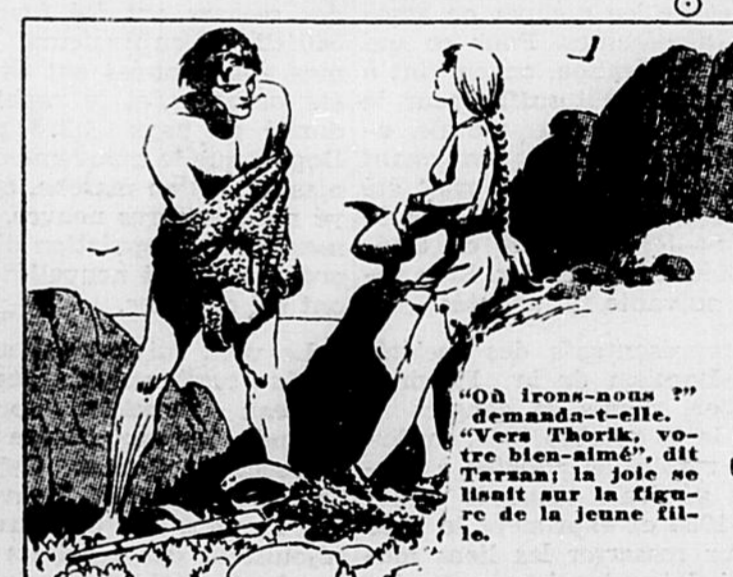
"Où irons-nous?" demanda-t-elle. "Vers Thorik, votre bien-aimé," dit Tarzan; la joie se lisait sur la figure de la jeune fille.