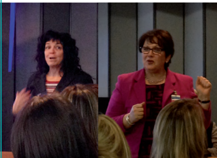
Lors de la présentation synthèse du dévoilement des résultats par les visiteurs d'Agrément Canada

La Direction générale du CSSS tient à remercier l'ensemble de son personnel et des médecins pour leur engagement à offrir des soins de santé sécuritaires et d'une grande qualité aux usagers.