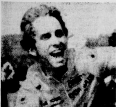
Greg LeMond, hier, à Paris.