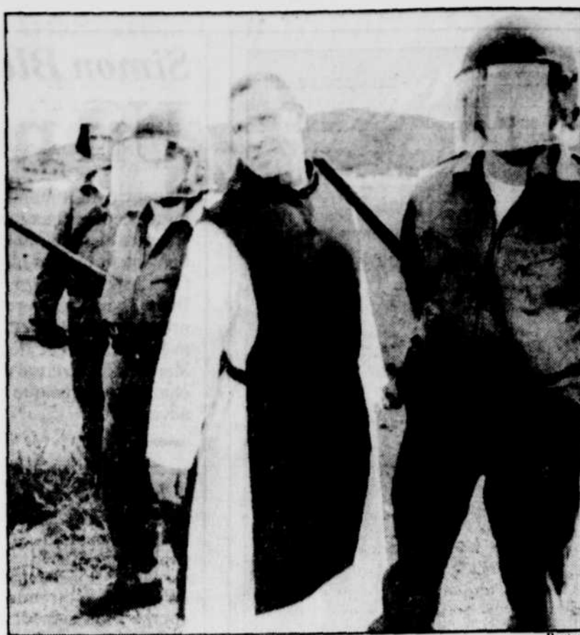
Des manifestants ont remis hier aux moines d'Oka des victuailles à l'intention des Mohawks assiégés. Les moines, dont celui que l'on voit sur cette photo, ont vainement tenté de faire passer les vivres mais ont dû les remettre à la Croix-Rouge.