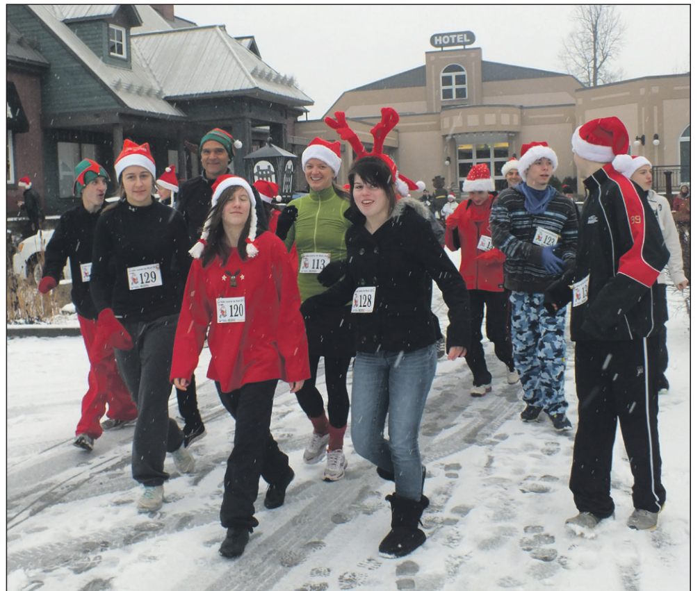
Un groupe de jeunes participants, bien motivés malgré la température.