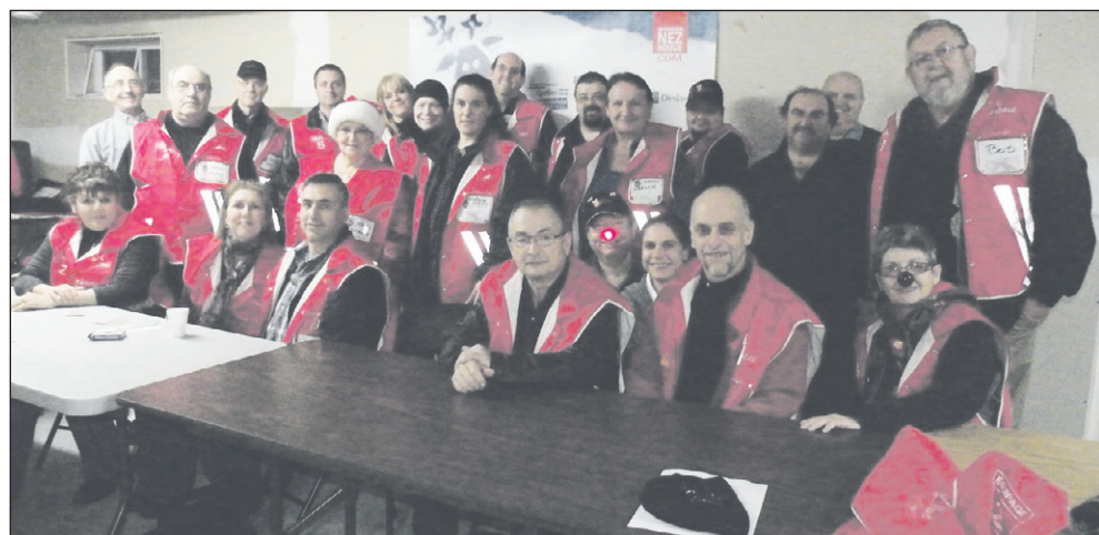
L'équipe de bénévoles de l'Opération nez rouge.

Numéro de téléphone pour les raccompagnements : 819-449-6935.