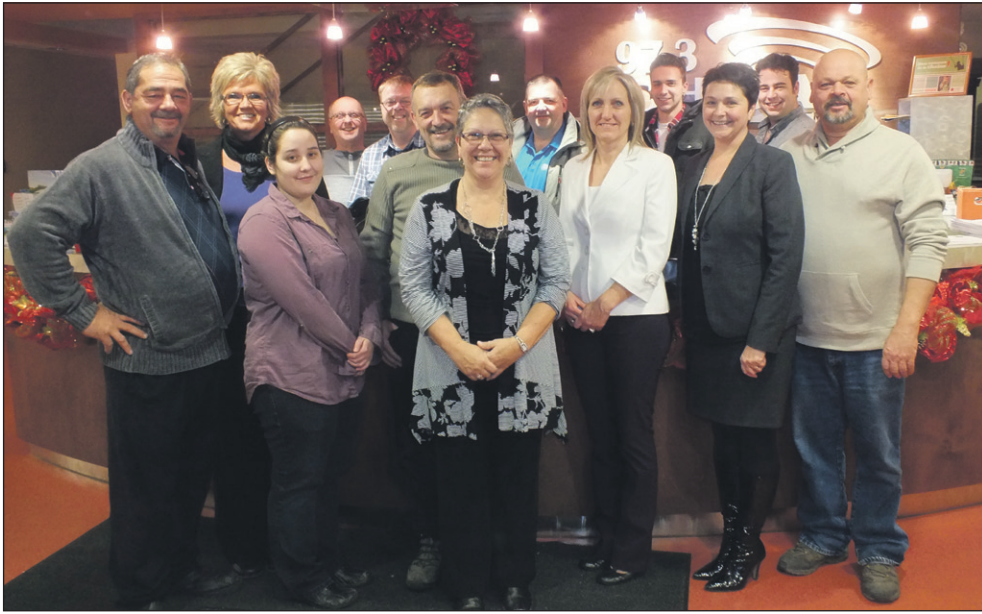
Des membres de l'équipe et du conseil d'administration de CHGA lors de l'assemblée générale annuelle de la radio.