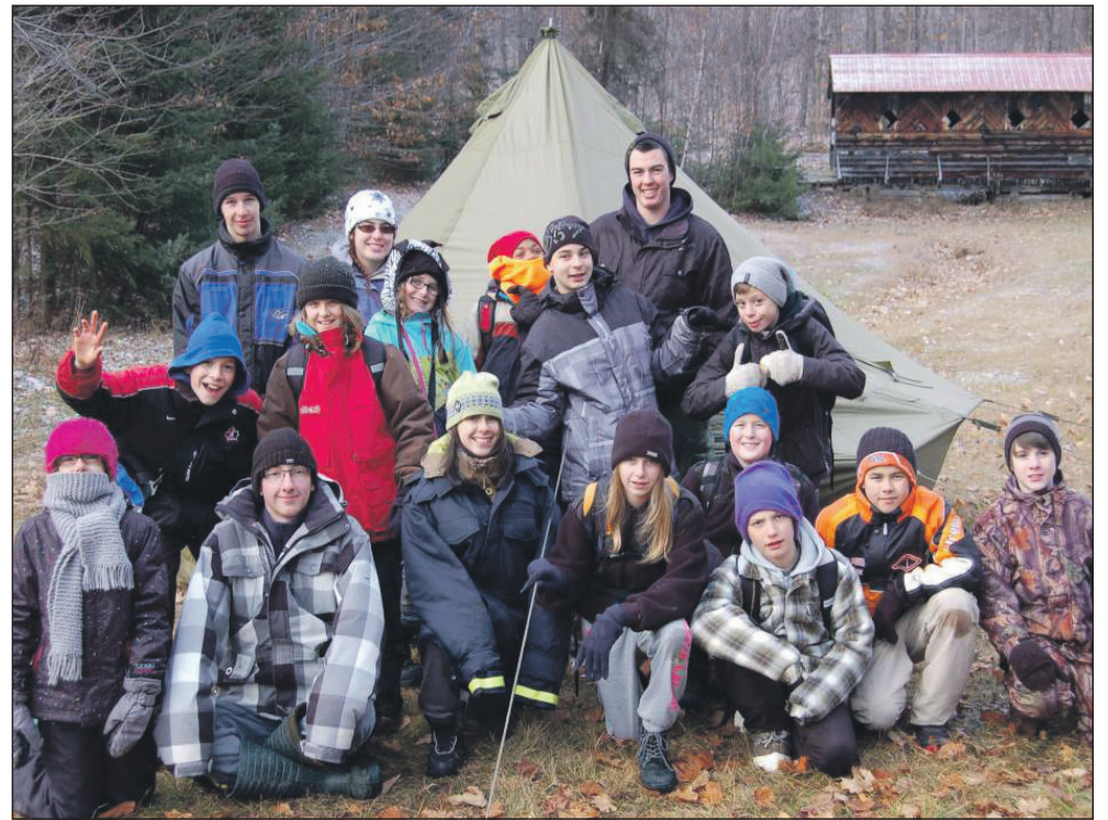
Une partie des cadets de Maniwaki durant l'exercice «Feuilles en couleurs».