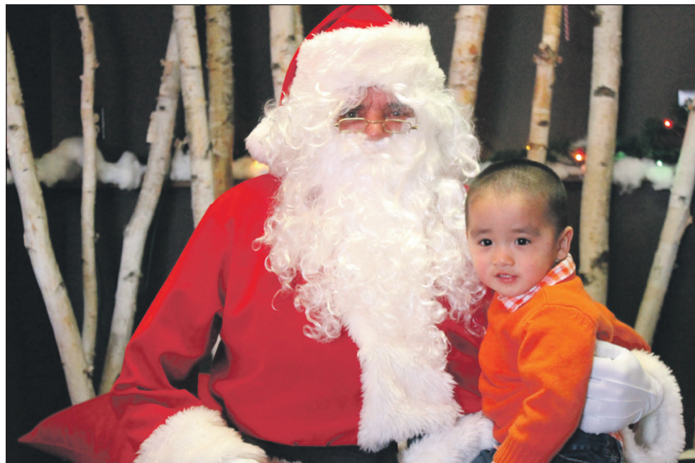
Les enfants pouvaient se faire photographier avec le Père Noël.

voient. Le Père Noël était au restaurant Smoke'n'grill, dimanche 9 décembre.