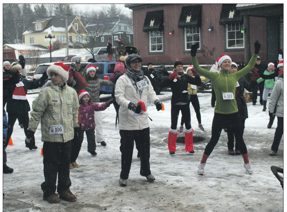
Séance d'échauffement avant le départ.