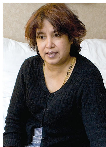
Taslima Nasreen lors de son passage à Montréal l'an dernier.

Basé à Londres, M. Rushdie, auteur des Versets sataniques (1988), devait se rendre, fin janvier, au Rajasthan pour participer au Salon du livre de Jaipur. Des fondamentalistes musulmans ont soulevé un tollé. Il a renoncé à faire le voyage après avoir été informé que des tueurs à gages avaient apparemment été embauchés par la