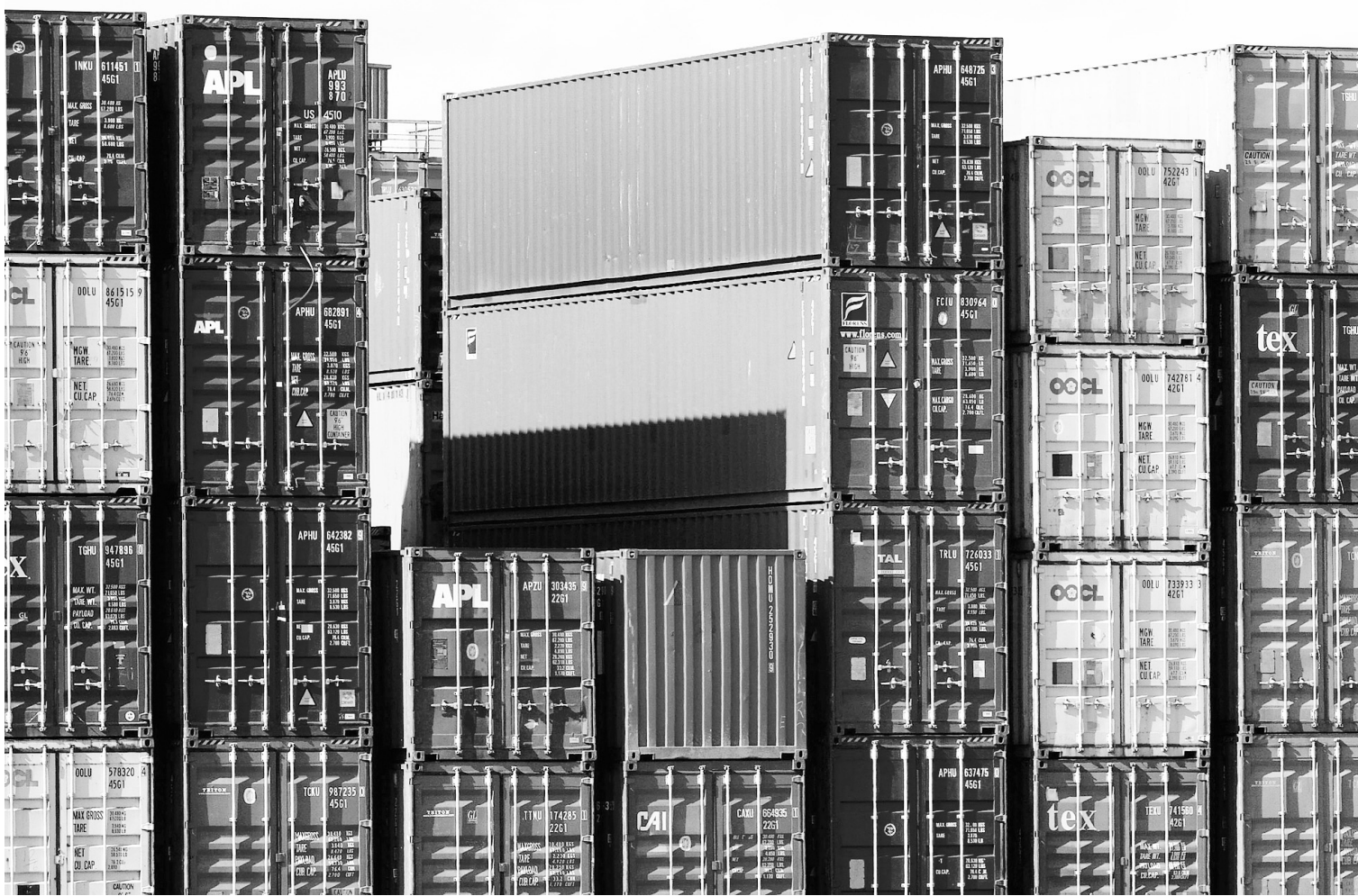
PHILIPP GUELLAND AGENCE FRANCE-PRESSE