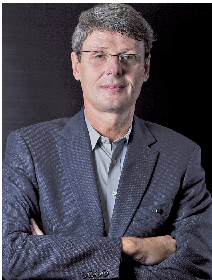
Thorsten Heins, directeur général de RIM