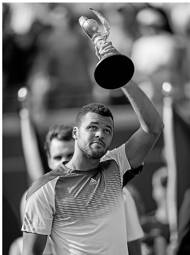
Jo-Wilfried Tsonga a soulevé le trophée de la Coupe Rogers hier à Toronto.