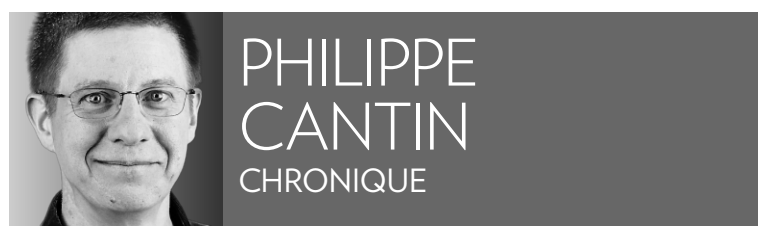
PHILIPPE CANTIN CHRONIQUE

Avez-vous déjà eu la chance de voir Rome? De marcher dans le Colisée, de visiter le Musée du Vatican ou de manger une gelato – la crème glacée traditionnelle – dans le quartier de Trastevere?