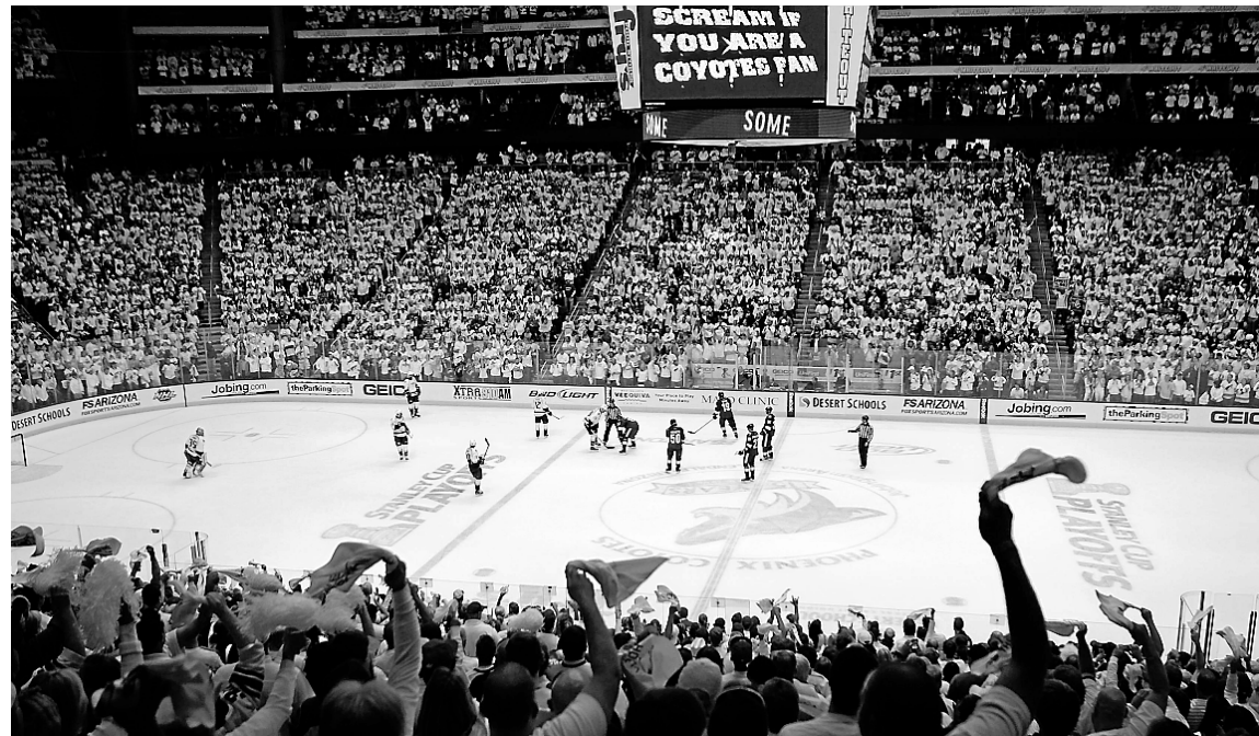
La présence des Coyotes en Arizona n'est pas étrangère à l'épanouissement de deux jeunes hockeyeurs originaires de cet État invités au camp de développement de l'équipe américaine des moins de 20 ans.

Le rôle des joueurs des Coyotes — actifs ou retraités — n'est pas négligeable non plus. Brian Savage