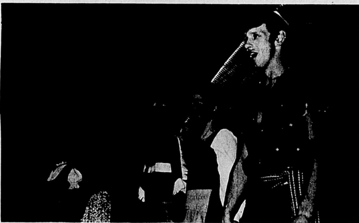
Plusieurs nationalités étaient représentées, au Carrefour de la "Nouvelle Dimension". En exclusivité, pendant la présentation de leur spectacle à la suite duquel, ils furent très applaudis.

façon de transmettre l'amitié et la bonne entente. Souhaitons que cette troupe d'un genre nouveau fasse rayonner sa joie de vivre. (A.B.)