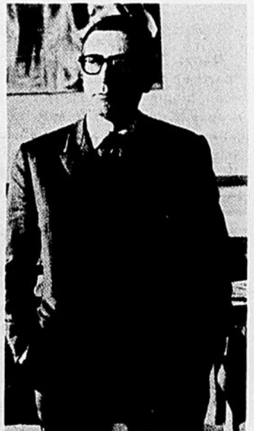
Le prix annuel de la revue Études françaises , de l'Université de Montréal, a été décerné au poète Gaston Miron, l'un des principaux animateurs de la poésie québécoise. À cette occasion, les Presses de l'U. de M. ont publié le deuxième recueil de poèmes et de proses du poète, L'homme rapaillé , le premier ayant paru en 1953. Car, paradoxalement, tout en étant l'une des plus grandes figures de la poésie québécoise contemporaine, Miron a été peu publié, si l'on excepte les nombreux textes parus depuis 20 ans dans les pages des journaux et des revues. Fondé en 1967, le prix des Études françaises s'accompagne d'une bourse de $ 2 000 et couronne l'oeuvre d'un écrivain francophone de nationalité autre que française.