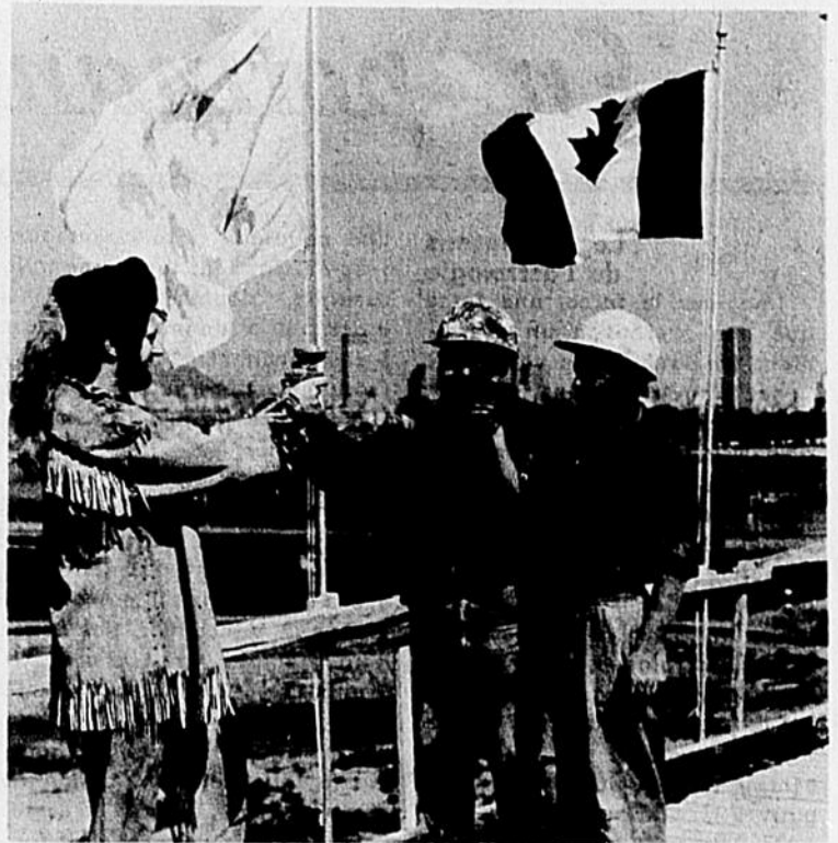
Panachage: Un rappel historique a marqué le panachage du premier immeuble de bureaux de l'Île-des-Sœurs: le "1 Place du Commerce". En souvenir de Jacques Le Ber qui, vers le milieu du 17e siècle, tenait un commerce de fourrures fort lucratif dans l'île, on a remis en évidence ce costume du coureur des bois de l'époque. Les bâtisseurs du premier building d'un ensemble d'immeubles de bureaux des Structures Métropolitaines du Canada Limitée ont salué le drapeau "blanc et or" d'avant la Révolution française au moment où on le hissait devant l'horizon de Montréal. Les premiers locataires du building, The Canada Starch Company Limited, occuperont les deux étages supérieurs.