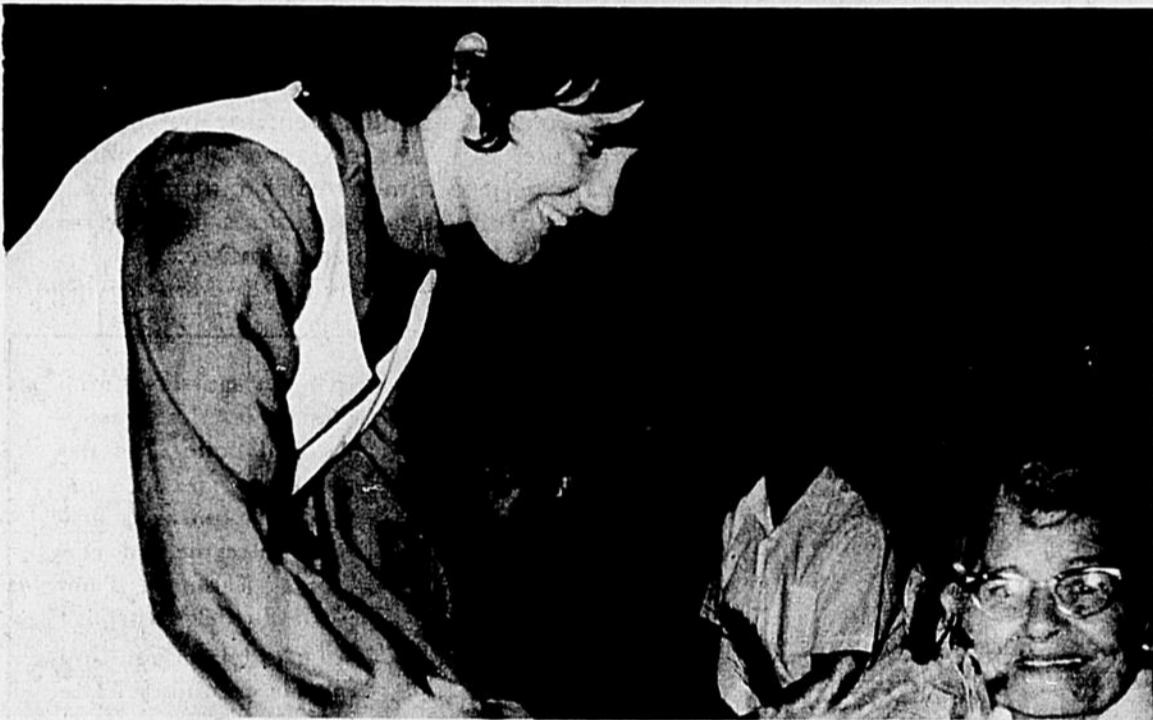
L'arbre de l'amitié fut transmis aux spectateurs assistant aux performances de la troupe "La Nouvelle Dimension". Le public a fort goûté ce style nouveau de communication, cette nouvelle

d'honneur, au moment où il donne lecture d'une déclaration d'entente et d'amitié, au nom des membres de la troupe. Un très nombreux public était présent. (A.B.)