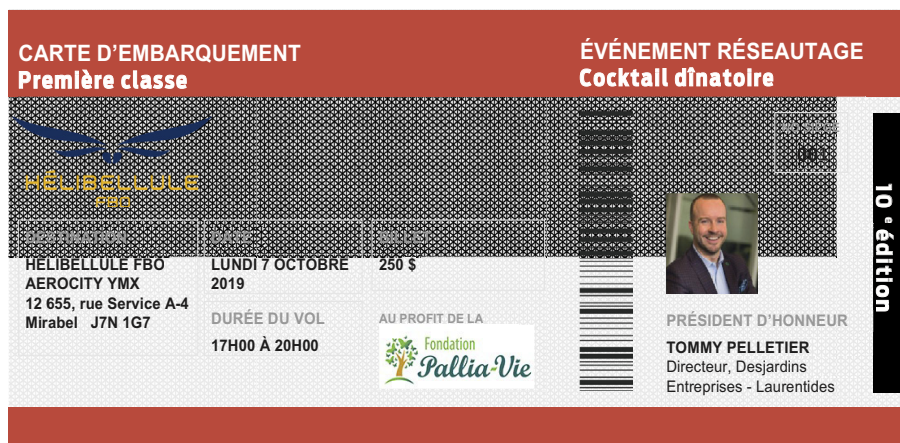
Soirée réseautage | 7 octobre 2019