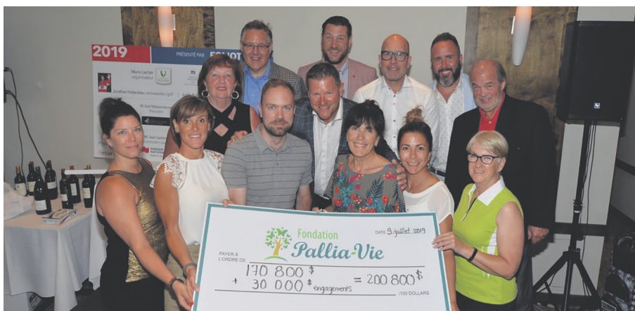
Golf / Vélo | 9 juillet 2019, succès inégalé ! 200 800 $