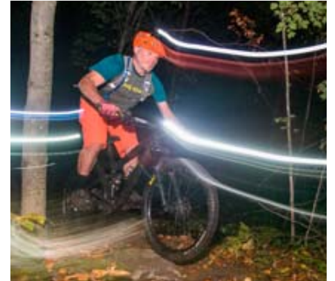
Un cycliste dans les pistes du Chanteclerc.

« Je suis extrêmement fière d'annoncer que la Ville de Sainte-Adèle fera officiellement l'acquisition de trois terrains lors de la séance du conseil municipal du 21 octobre. Ces trois terrains représentent 92 acres, soit près de 12 % de la superficie totale du parc. Combiné aux deux terrains que possède déjà la Ville, ceci correspond à 30 % du territoire convoité pour le Parc et donc, à une plus grande superficie que le Chanteclerc », a annoncé la mairesse Nadine Brière, devant une foule nombreuse rassemblée au Chanteclerc, malgré la température incertaine. « Ce n'est qu'un début puisque des négociations sont en cours avec les autres propriétaires et nous sommes confiants de pouvoir faire des nouvelles annonces très bientôt », a ajouté la mairesse. Il s'agit d'un