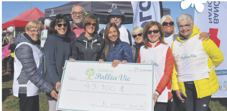
Je marche pour Toi ! | 29 septembre 2019 49 100 $