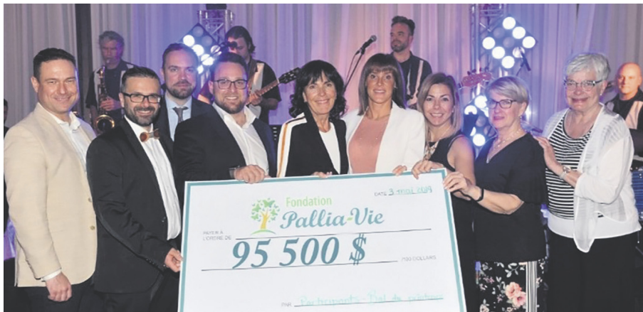
Bal du printemps | 3 mai 2019 95 500 $