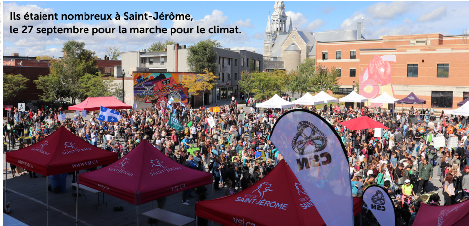
Ils étaient nombreux à Saint-Jérôme, le 27 septembre pour la marche pour le climat.