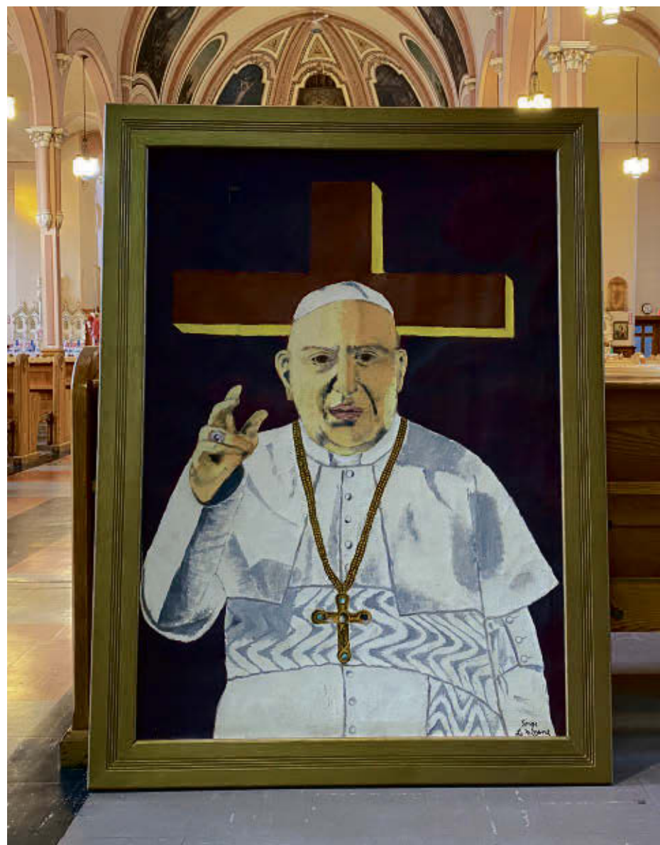
L'œuvre Jean XXIII de Serge Lemoyne est exposée à l'église Saint-André d'Acton Vale.