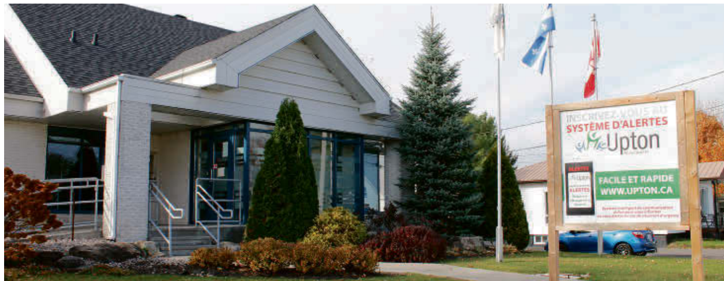
La consultation publique se déroulera le 6 décembre à la salle du conseil d'Upton.

du sol est soumise à des contraintes particulières pour des raisons de sécurité publique, telles des zones d'inondation ou de glissement de terrain », est-il écrit dans la résolution visant l'adoption du premier projet de règlement.