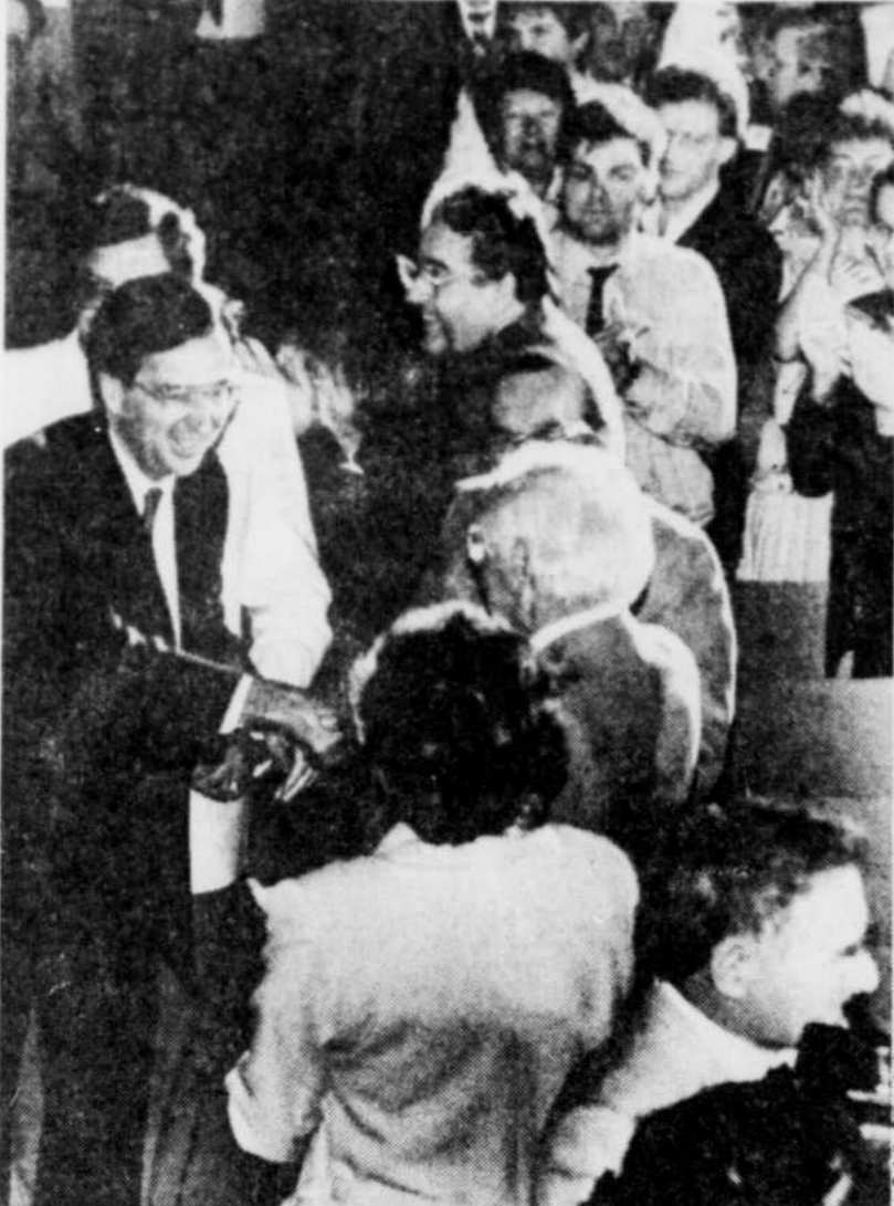
Le premier ministre Bourassa (à gauche) a consacré une large partie de son allocution, hier après-midi, devant 800 militants libéraux de la région de Québec, pour défendre, point par point, la valeur de l'accord négocié au lac Meech, jeudi.