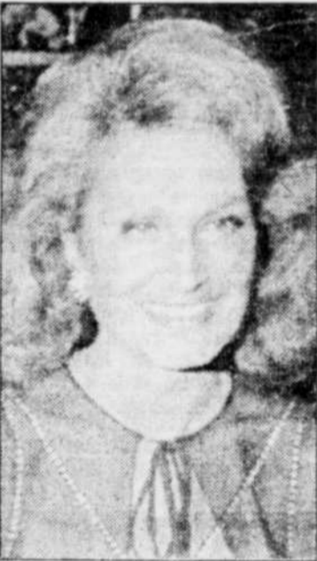
La chanteuse Dalida.