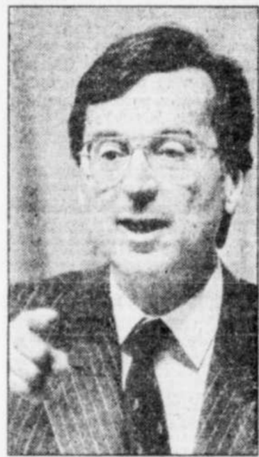
M. Robert Bourassa.