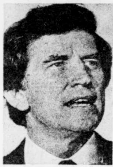
L'ex-sénateur Gary Hart

♦ MIAMI (AFP, AP) - La controverse aux États-Unis selon laquelle le favori pour l'investiture démocrate à la prochaine élection présidentielle, l'ex-sénateur Gary Hart, aime trop les