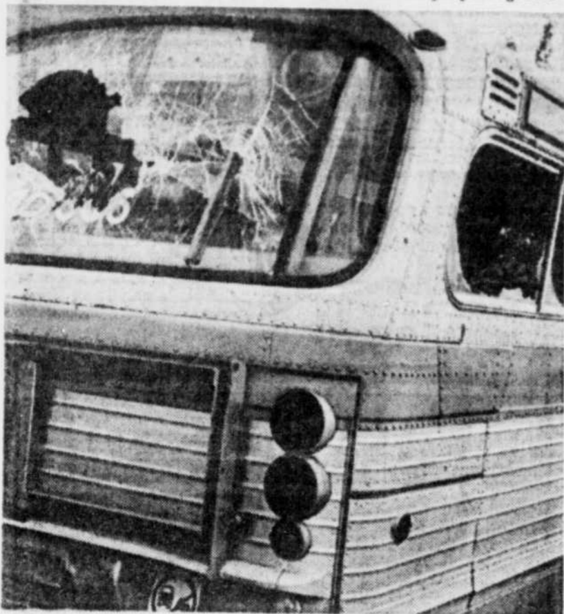
Un des autobus de la Société de transport de la Communauté urbaine de Montréal a été endommagé, hier, aux environs du parc Jarry.

Dans ce cas, les services essentiels sont assurés aux heures de pointe mais, comme le dit le ministre, cet arrêt de travail occasionne des inconconvénients sociaux et économiques. ♦