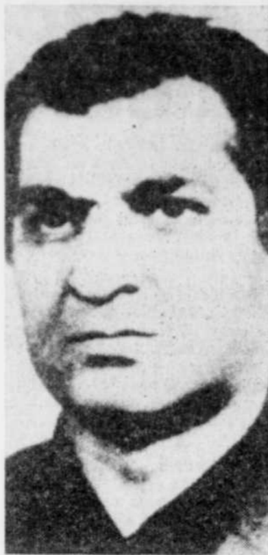
M. Babrak KARMAL

L'écoute de Radio-Kaboul, la radio officielle afghane, n'a pas permis d'entendre une quelconque information pouvant laisser croire que Karmal était emprisonné. ●