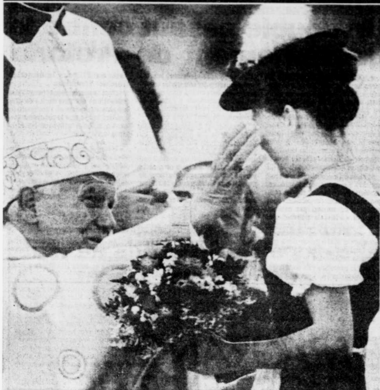
Le pape Jean-Paul II accueille avec plaisir une jeune Bavaroise en costume traditionnel venue lui présenter des fleurs hier au stade olympique de Munich. Le pape rentre à Rome ce soir.