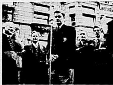
"Hé ben... Euh"