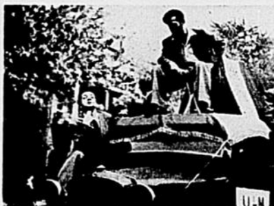
Les Beaux-Arts en "poussent" de bonnes