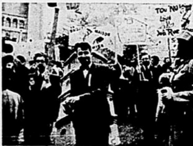
Deux "extroverts" de lettres

Venaient ensuite les étudiantes de Diététique, distribuant aux spectateurs des tartellettes au vitriol. Elles étaient suivies des Polytechniciens, portant des tabliers de ponts. Puis, dans un grand brouhaha, on pouvait distinguer les Philosophes avec la Somme; les H.E.C. avec le Produit; les Relations Industrielles portant la Division; cependant que la Pharmacie combait la Différence.