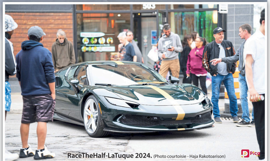
RaceTheHalf-LaTuque 2024.

Si les voitures sont regroupées en différentes catégories et que des trophées récompensent les plus rapides, l'esprit reste festif. « C'est compétitif, mais comparé à une piste de drag de quart de mile,