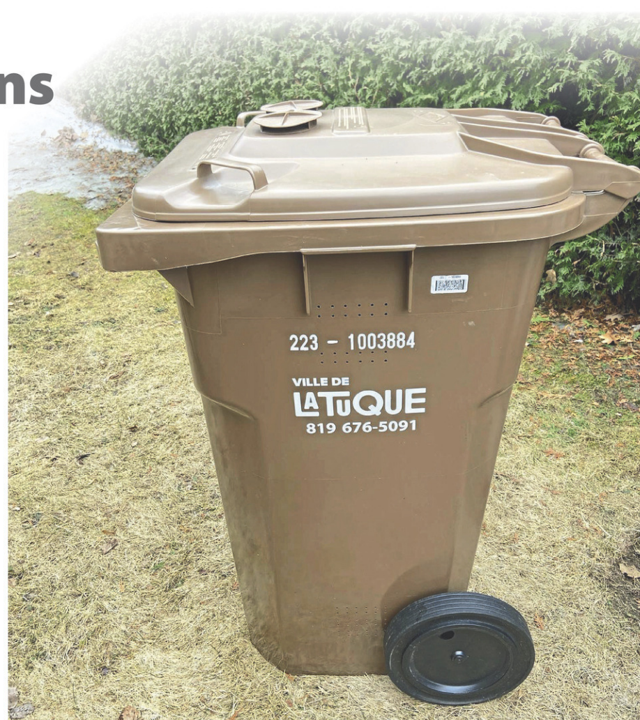
Seulement 30% des bacs ont été levés en moyenne depuis leur implantation en septembre 2024

Lors des premières statistiques disponibles dans la région lors de l'implantation des bacs bruns en 2023, Trois-Rivières était en tête selon les statistiques avec une moyenne de levée des bacs à 75% pour les mois de juin et juillet 2023. À Shawinigan, le taux était de 58% pour le mois de juin 2023, et de 59% en juillet 2023. Dans la MRC des Chenaux, le pourcentage était de 55% en juin 2023, comparative-ment à 56% en juillet 2024. La MRC de Maskinongé a montré un taux de levée de 45% en juin 2023, et de 50% en juillet 2024. C'est dans la MRC de Mékinac que le taux a été le plus bas lors de cette première année de récolte des matières compostables avec 42% en juin 2023, et 44% en juillet 2023.