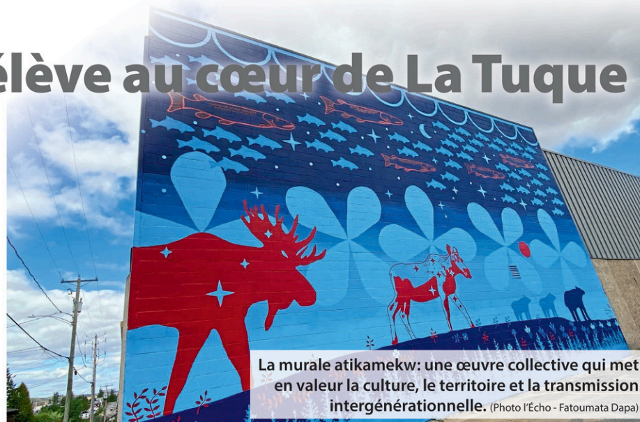
La murale atikamekw: une œuvre collective qui met en valeur la culture, le territoire et la transmission intergénérationnelle.

Les artistes insistent sur le caractère populaire et rassembleur d'une murale. «Ce n'est pas tout le monde qui va se rendre dans un musée ou une galerie d'art. Tandis que la murale, c'est accessible à tout le monde.