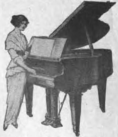
Oh! ces gammes... que c'est difficile!...

Dans le cercle moyen se trouvent toutes les gammes majeures, dans le petit cercle toutes les gammes mineures; d'un côté pour les dièses, et de l'autre pour les bémols. — Par exemple, vous voulez avoir la gamme d'un dièse: du côté du carton contenant les gammes en #, dans le cercle moyen, vous cherchez la case où se trouve I#; au-dessus de I# vous aurez la note SOL (1er note de cette gamme). Placez la note SOL dans le même rayon que la note DO du grand cercle; vous n'avez plus qu'à lire, dans le cercle moyen, chacune des notes se trouvant au-dessus de chacune des notes de la gamme-mère DO (majeur) et vous avez votre nouvelle gamme SOL MAJEUR. Dans le petit cercle maintenant, dans le même rayon que SOL, vous avez la note MI qui est la tonique (1er note) de la gamme relative mineure de SOL. Lisant à présent, dans le petit cercle, chacune des notes en dessous de la gamme de DO mineur du grand cercle, vous aurez votre gamme relative mineure de MI. — Chaque degré de la gamme DO du grand cercle est numéroté: chaque degré de la nouvelle gamme que vous venez de former, comportera le même numéro. Ce qui a permis à l'inventeur de donner une formule générale, par laquelle on peut avoir, pour chaque gamme majeure ou mineure, ses accords parfaits.