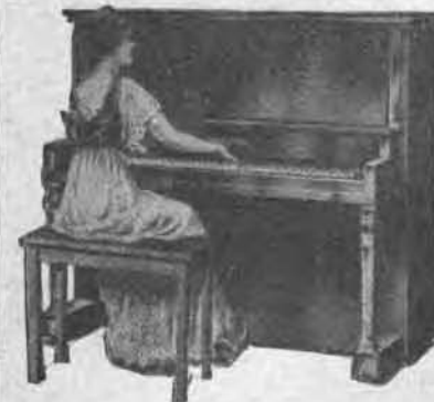
Si j'avais donc connu plus tôt le "Transpositeur".

Le "Transpositeur" est présentement en usage dans les plus importantes maisons d'Education de Montréal. L'inventeur a reçu de toutes ces maisons, ainsi que des professeurs de musique les plus distingués, des références tout-à-fait flatteuses. Achetez le "Transpositeur-Lagacé" qui vous sera d'un très grand secours.