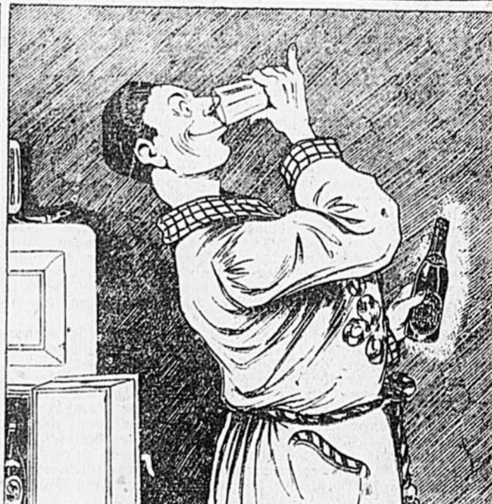
TAS-PAS DÉJÀ ESSAYÉ UNE BLACK HORSE? C'EST MOINS COMPLIQUÉ ET BEAUCOUP PLUS SÛR

dites simplement - "Bière Black Horse Dawes s.v.p.!"