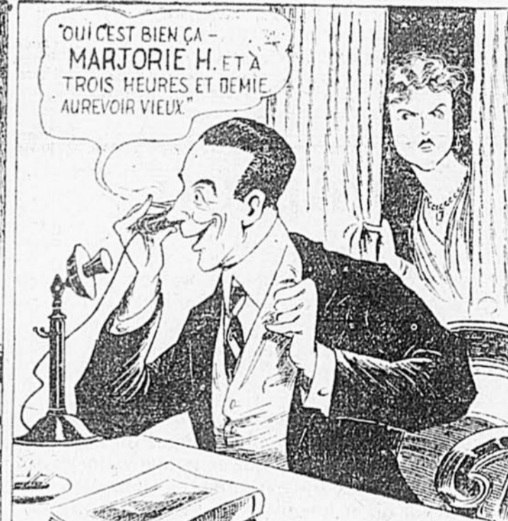
MAIS TON ÉPOUSE, QUI PASSAIT PAR HAZARD, NE LE COMPRIT PAS DE LA MÊME FAÇON -