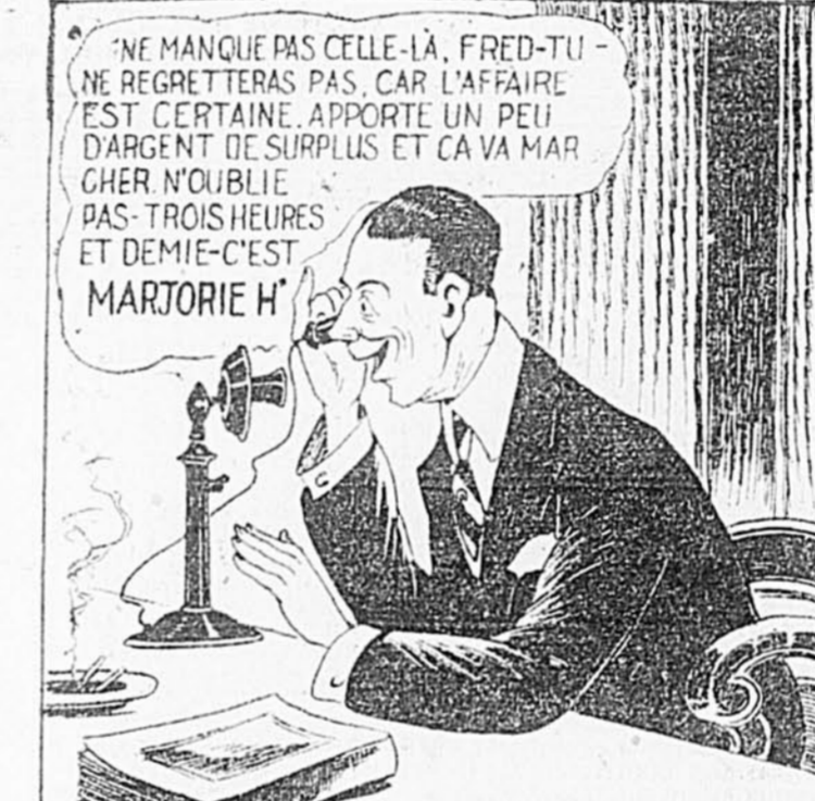
TAS-PAS DÉJÀ TENU UNE CONVERSATION TÉLÉPHONIQUE DANS LE GENRE DE CELLE-CI AVEC UN AMI À QUI TU PASSAIS UN TUYAU SUR UNE CERTAINE COURSE -