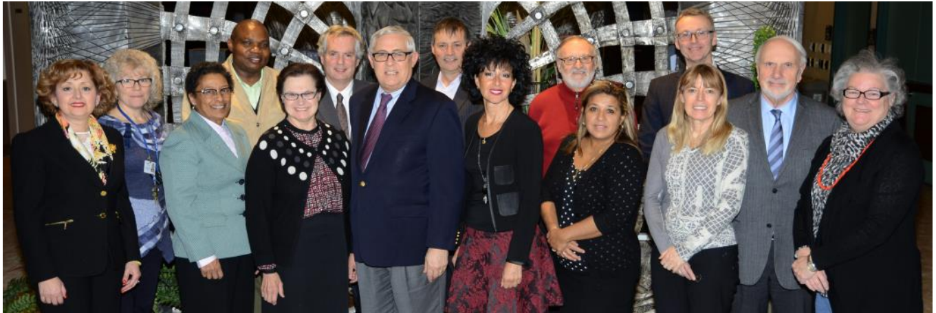
Conseil d'administration sortant (IUGM), mars 2015

Nous tenons à informer nos membres que la réforme dans le domaine de la santé et des services sociaux amorcée par le gouvernement libéral est maintenant en vigueur depuis avril 2015. Prenons le cas de l' Institut Universitaire de Gériatrie de Montréal (IUGM) pour illustrer le