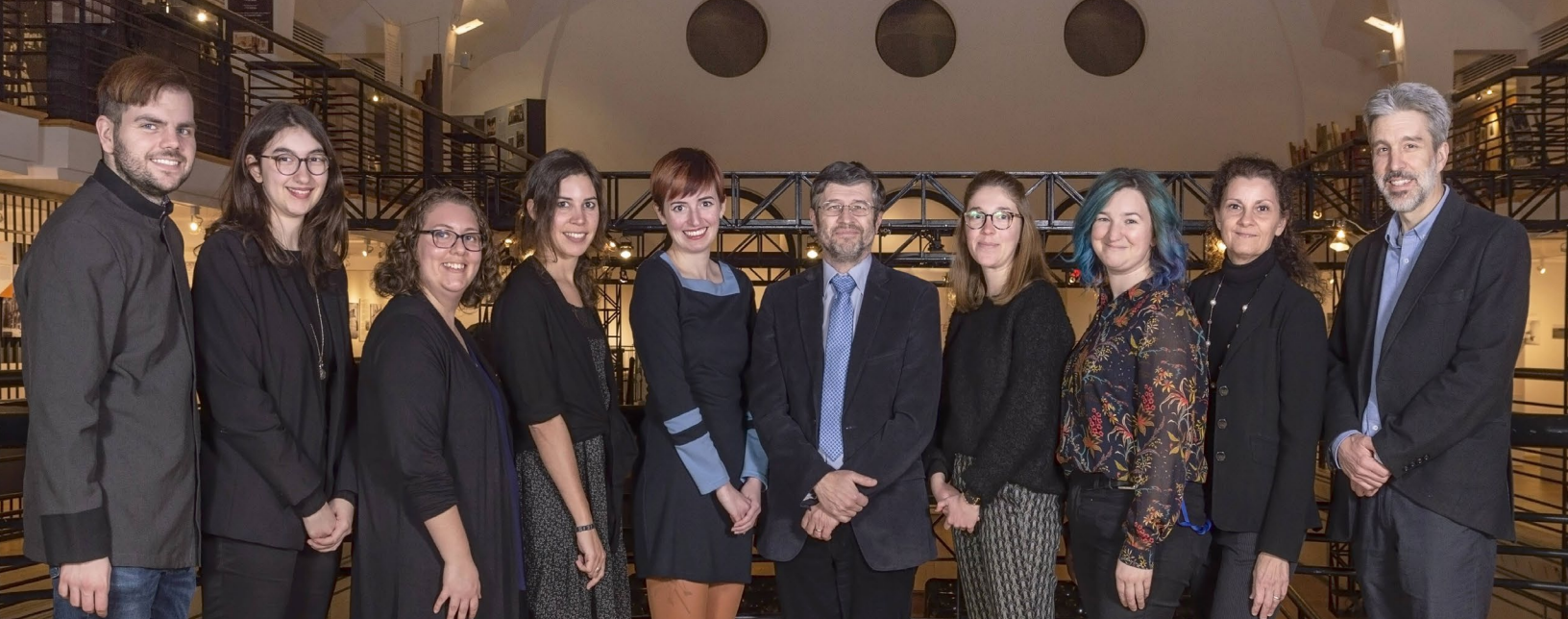
Équipe de l'Écomusée