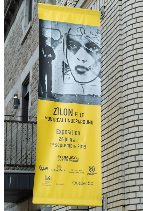
Exposition Zilon et le Montréal underground