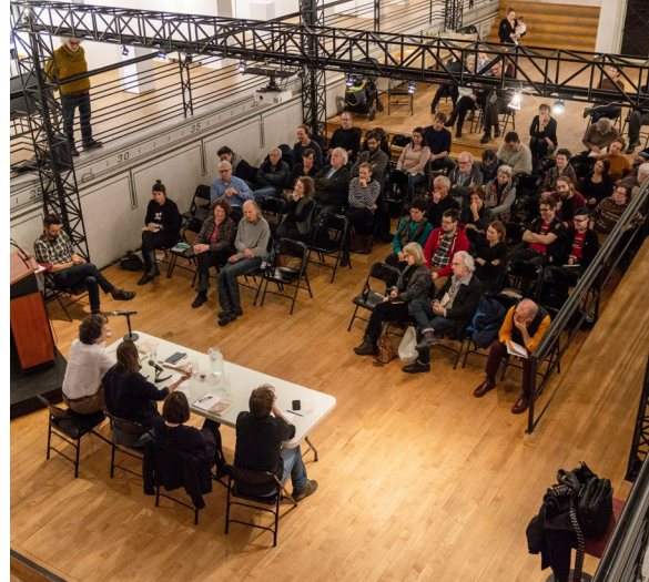
Lancement du livre On n'est pas des trous-de-cul dans le cadre de l'exposition Déjouer la fatalité : pauvreté, familles, institutions

Au cours de l'année, 24 activités proposées par l'Écomusée étaient gratuites auxquelles s'ajoutent 13 journées en accès libre, favorisant l'accessibilité à tous les publics.