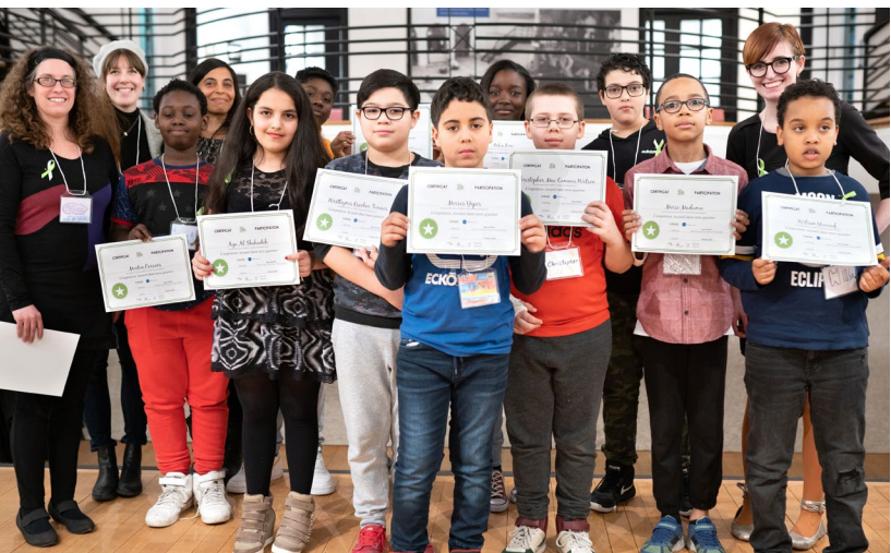
Vernissage de l'exposition Accueil dans mon quartier, les élèves de l'école Jean-Baptiste-Meilleur et les intervenantes