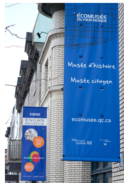
Façade de l'Écomusée