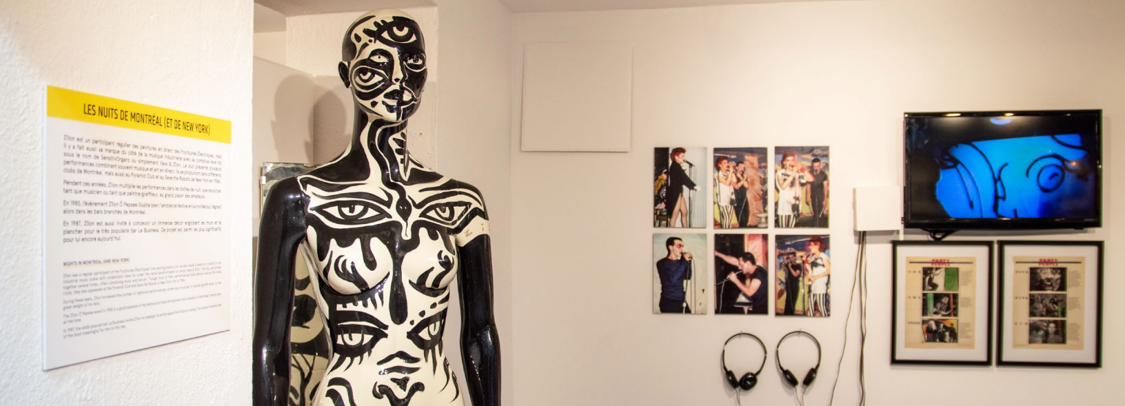
Exposition Zilon et le Montréal underground