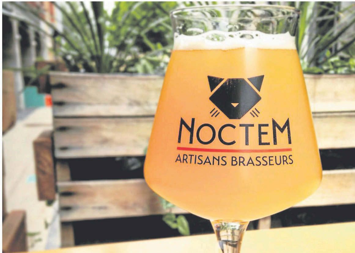
Le Noctem propose une sélection de bières brassées sur place. La cuisine est également fort intéressante, le chef s'amuse et c'est un plaisir de le suivre dans ses inspirations.

Avant tout un bar à bière attaché à une cuisine très créative,