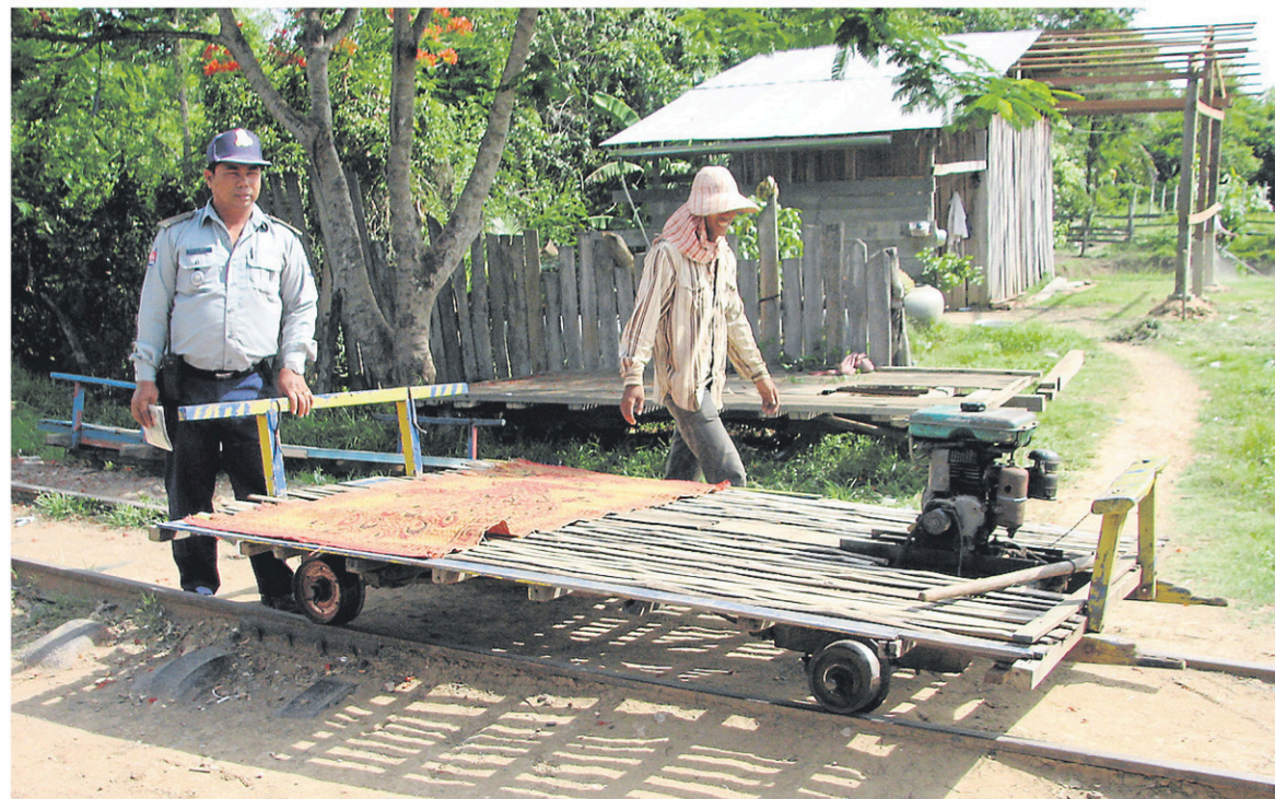
Le train de bambou consiste en une plateforme de bois sur des roues. Il est propulsé par un petit moteur à bateau.

Suivez mes aventures au www.jonathancusteau.com