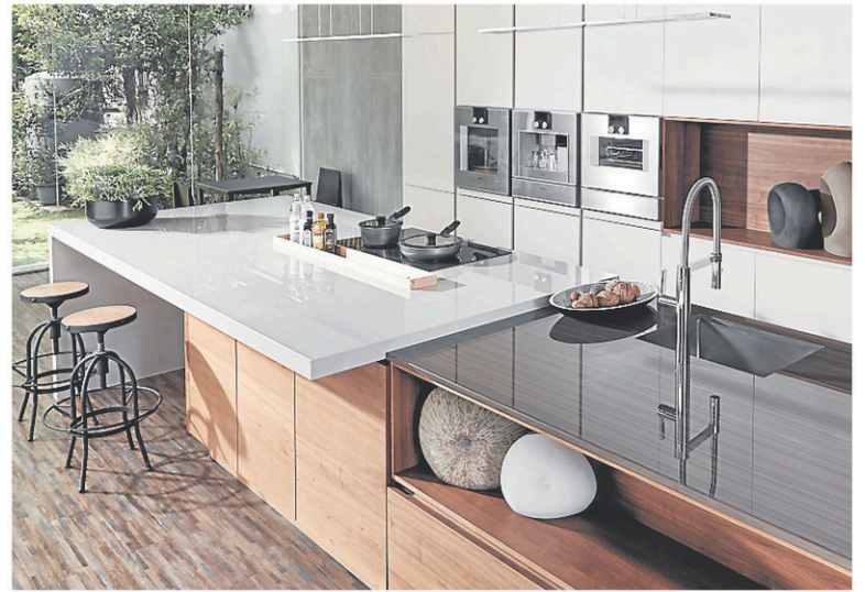
Le Geoluxe a été mis au point après des années de recherche. Il peut être installé à l'intérieur comme à l'extérieur. Il s'inspire du marbre.