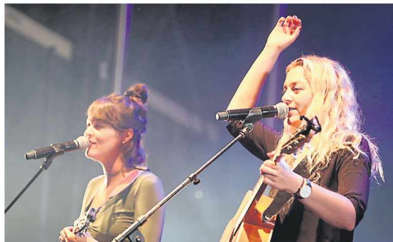
Les Sœurs Boulay ouvriront le festival Saint-Paul-d'Abbotsford dans tous ses arts le vendredi 22 septembre à 20 h au Centre communautaire des loisirs. Pour des billets: www.saintpaulabbotsford.qc.ca/loisirs-et-culture/festival/

L'Apéro en musique du Centre culturel St-John à Bromont vous donne rendez-vous avec les poètes Léo Ferré et Leonard Cohen le vendredi 22 septembre dès 17 h 30. BILLETS disponibles au www.centreculturelstjohn.com .