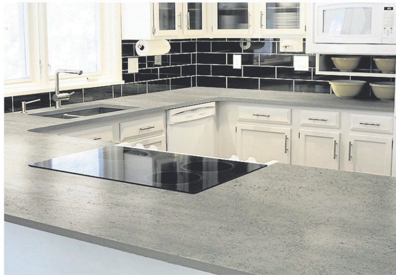
En ce qui concerne les plans de travail, plusieurs types de revêtements sont offerts chez Home Depot. Dans la cuisine ci-dessus, les propriétaires ont opté pour du Dekton.