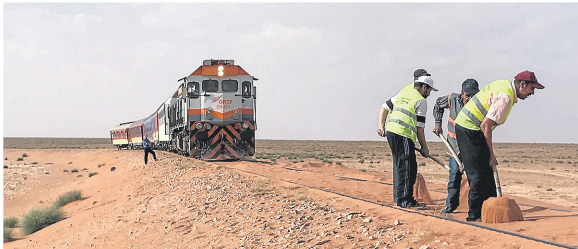
Pendant le trajet, le paysage défile lentement. Le train doit même s'arrêter quand le sable envahit les voies. Une équipe de cheminots armés de pelles descend alors pour dégager les rails.

Derrière lui, une vieille carte des chemins de fer : la ligne Oujda-Bouarfa perdue dans le désert, flirtant avec la frontière algérienne.