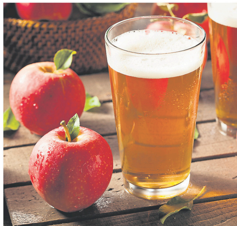
Vous n'aimez pas le cidre parce qu'il est trop sucré, trop amer, trop «insérez votre défaut»? Qu'à cela ne tienne, il existe autant de types de cidres qu'il y a de variétés de pommes.

Vous souhaitez prolonger l'été, mais n'avez ni le temps ni le budget pour sauter dans l'avion? Pas de soucis! Ce cidre pétillant