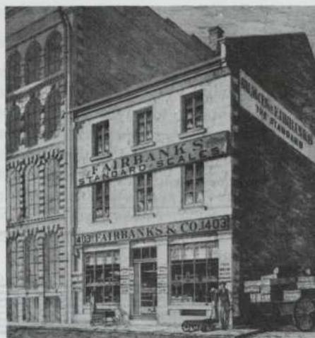
Magasin Fairbanks, rue Saint-Paul ouest

Une série de 68 photographies font découvrir des bâtiments d'envergure et de style différents, de la boutique de quartier au gratte-ciel.