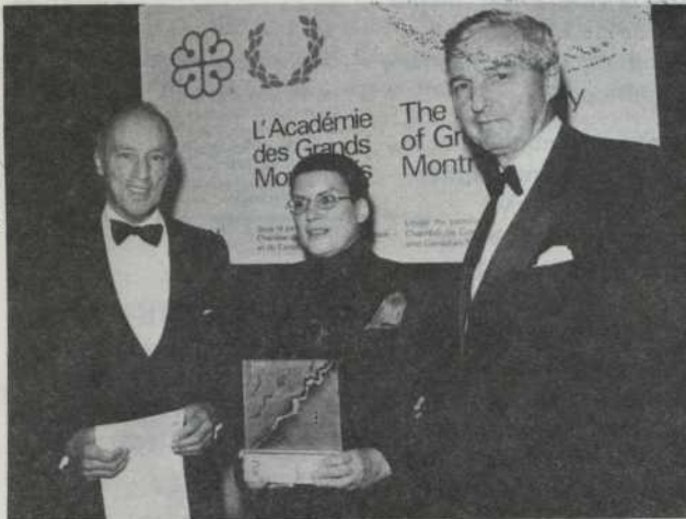
Les trois Grands Montréalais 1984: M. Pierre Elliott Trudeau, Mme Phyllis Lambert et M. Paul Desmarais

C'est sous les applaudissements de près de 1 000 convives que les trois Grands Montréalais de l'année, l'homme d'affaires Paul Desmarais, l'architecte Phyllis Lambert et le très honorable Pierre Elliott Trudeau ont fait leur entrée dans la Grande salle du Reine Elizabeth, le 25 octobre dernier.