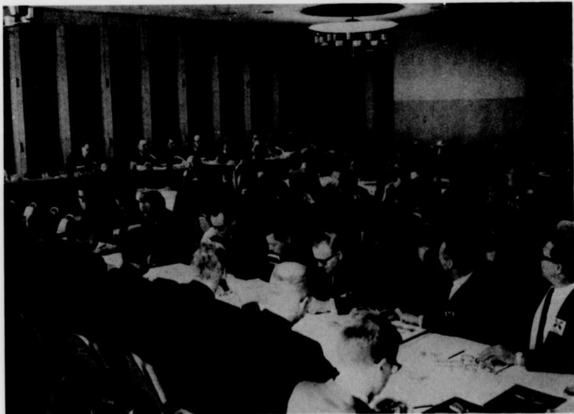
Les représentants des huit postes affiliés (télévision) étaient présents à la réunion.

«Enfin nous avons réaménagé certaines soirées pour les rendre plus attrayantes: satisfaire le public étant toujours notre règle d'or.»