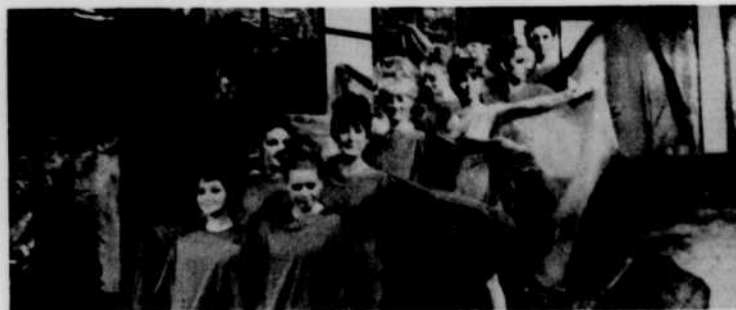
Des danses modernes agrémentaient le spectacle.