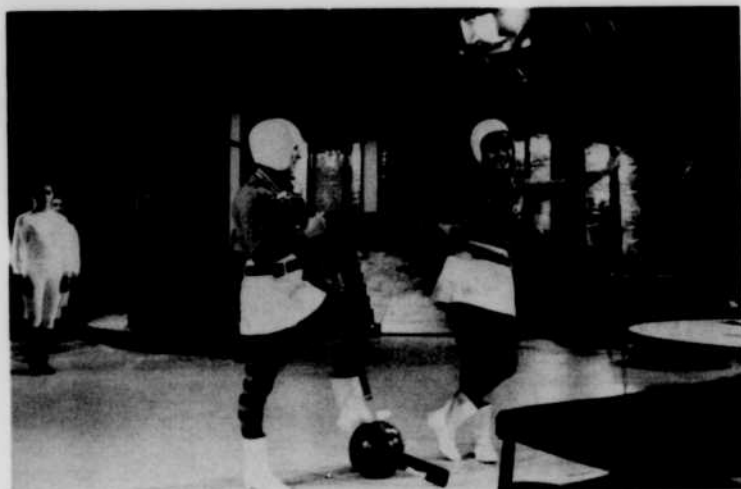
Qui sont ces deux joueuses d'un hockey pas très orthodoxe?

On ne peut maintenant souhaiter qu'une seule chose en terminant, c'est que, outre toutes les belles émissions qui sont déjà inscrites au programme, Radio-Canada redonne, à l'intention de ses amis téléspectateurs une présentation de ce spectacle, qui fut une réussite complète.