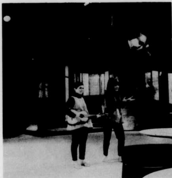
«Moi et l'autre», bien sûr! Nulles autres que Dominique Michel et Denise Filiatrault.