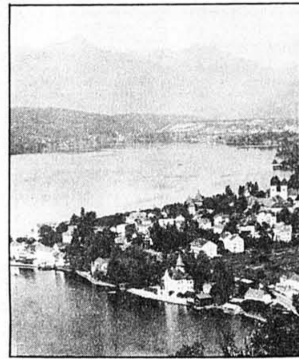
Encore aujourd'hui certains lacs et fleuves d'Autriche restent jonchés d'objets explosifs.

A Wiener Neustadt, au sud de Vienne, où les Nazis avaient aménagé d'importantes usines d'armes, aucun permis de construction n'est encore délivré sans que le terrain ait été d'abord testé pour établir qu'il ne renferme plus d'engins dangereux.