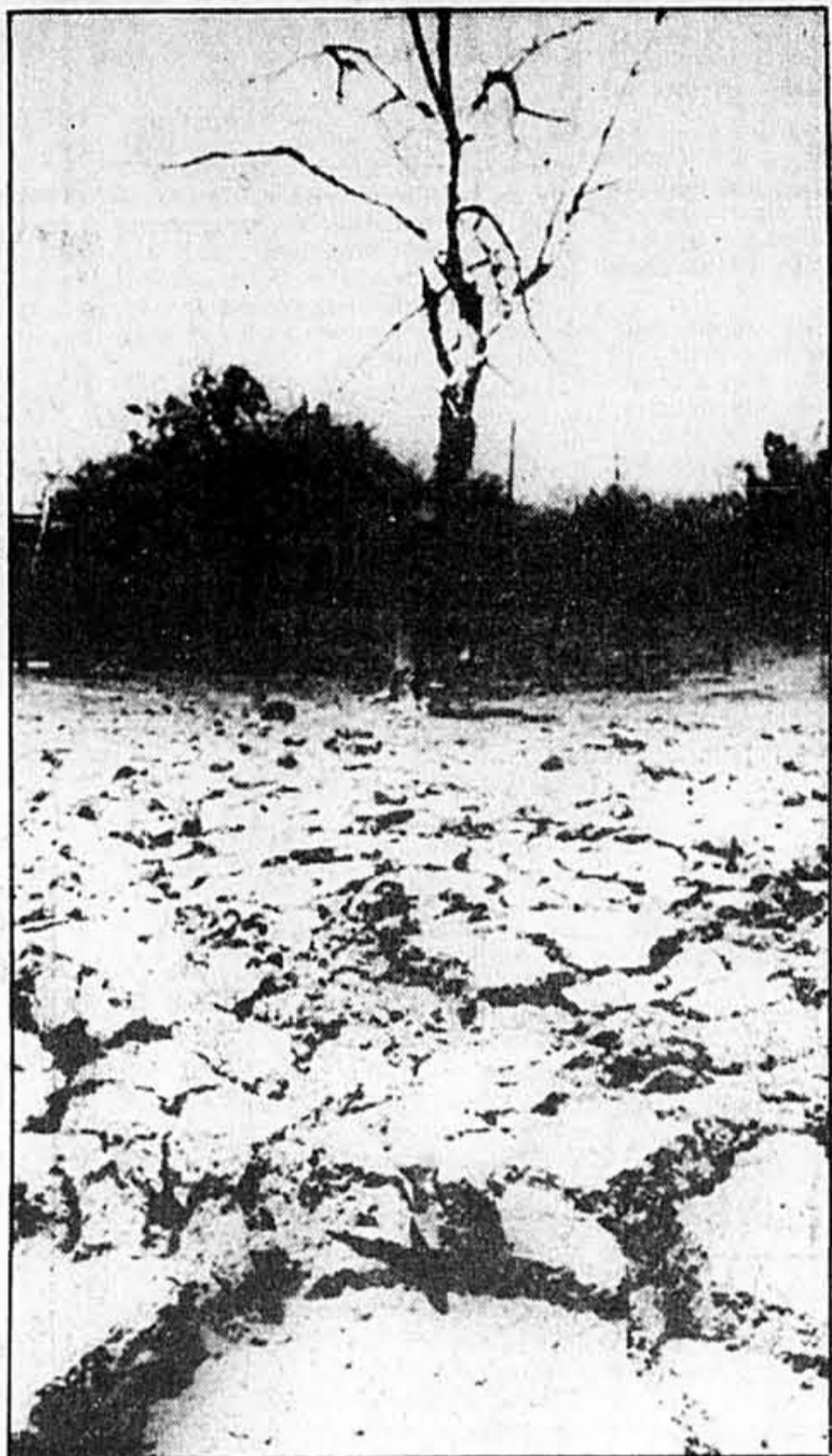
Sol craquelé, végétation nulle, c'est le paysage désolé que l'on rencontre en Afrique, où la sécheresse sévit depuis plusieurs années.

Worldwatch souligne également qu'un pompage excessif