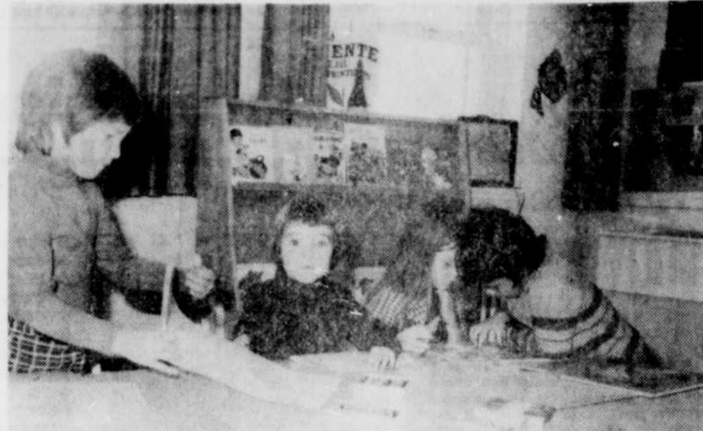
Au cours d'une rencontre d'information hier, on a traité des objectifs des classes de maternelles. La préparation à l'école et découvrir les aptitudes personnelles de chacun sont des buts visés. On voit ici quelques élèves en période de "travail" dans une classe de l'école St-David.

Le club de chasse et pêche les Mousquetaires de Victoriaville organise un concours de chasse à la perdrix et aux lièvres dimanche le 22 octobre. L'inscription se fera à la résidence de M. Paul Beauchesne samedi durant la journée. A noter que les gagnants seront déterminés par la pesanture des prises.