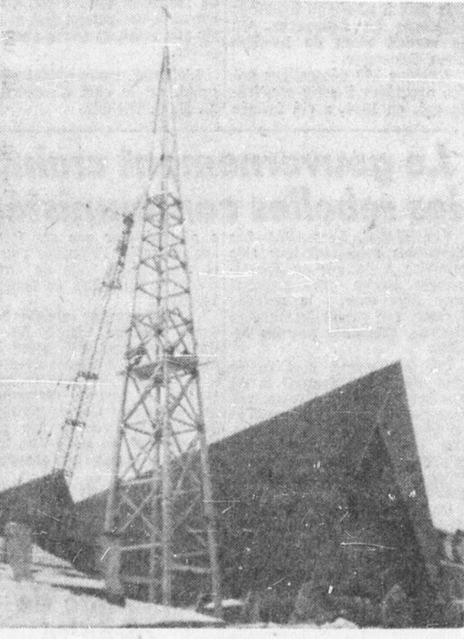
NOUVEAU CLOCHER de l'église Ste-Anne de Mattawa — Les paroissiens ont exprimé leur satisfaction, à la suite du succès remporté par les ouvriers qui ont monté le clocher de cette nouvelle église. Cette structure, haute de 140 pieds, portera un carillon de quatre cloches.