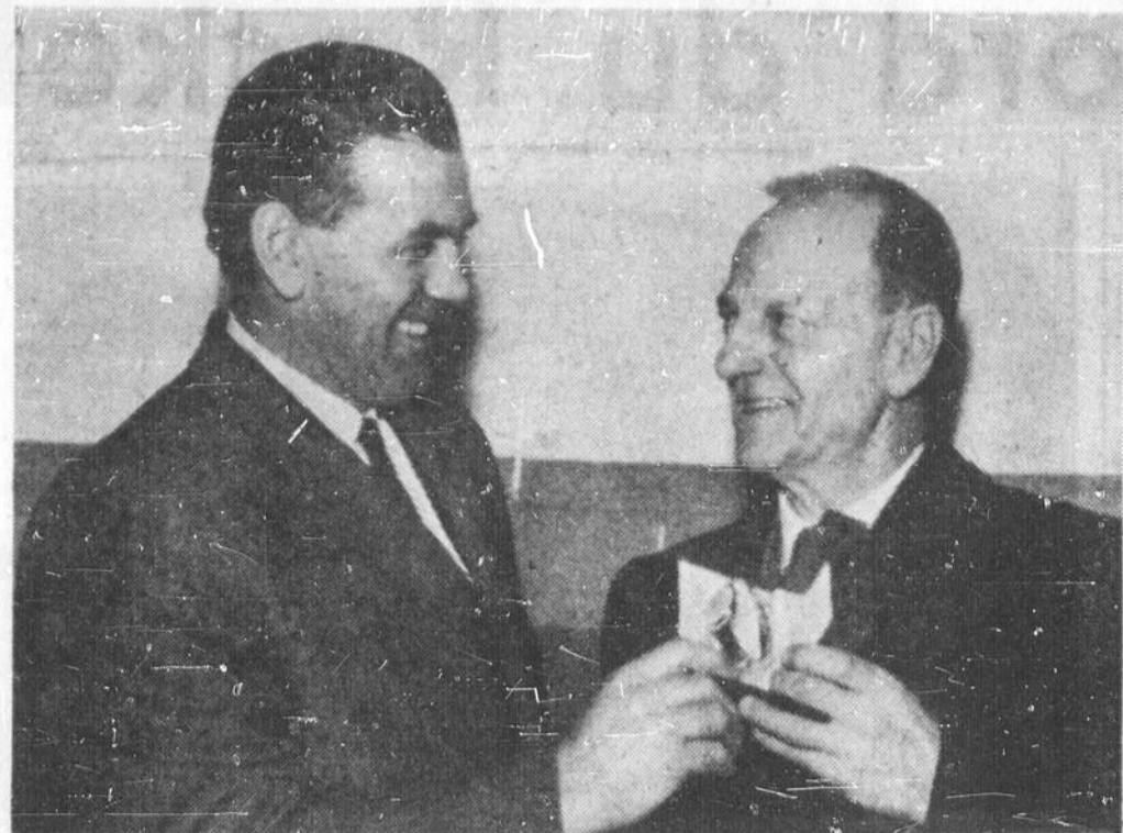
ANCIENNES VEDETTES DU CANADIEN Aurèle Joliat, à droite, montre à Maurice "Rocket" Richard une superbe montre plaquée or qu'il a reçue des Canadiens de Hull-Ottawa lors de la "soirée des célébrités" qui a eu lieu à l'aréna de Hull, jeudi soir. Richard, maintenant ambassadeur du hockey

pour l'organisation du Canadien, n'a cependant pas vu son ancien coéquipier Bernard "Boom Boom" Geoffrion égaliser le record de 50 buts qu'il a lui-même établi durant la saison 1944-1945. Joliat, un membre du Temple de la Renommée du hockey, a joué pendant 16 saisons avec le Canadien.