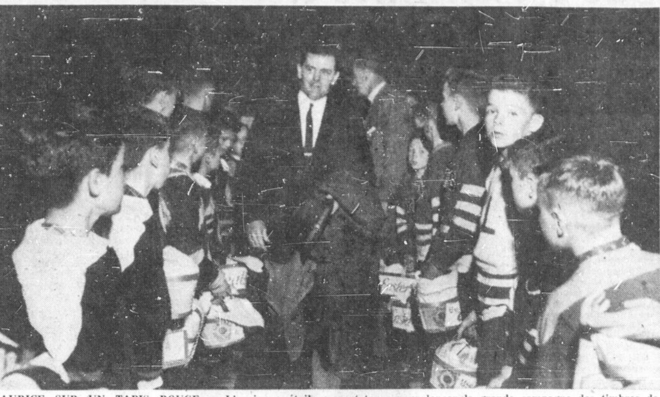
MAURICE SUR UN TAPIS ROUGE — L'ancienne étoile des Canadiens de Montréal, Maurice Richard, était à nouveau sur la glace mais sans ses patins, mercredi soir, à titre d'invité des Wolves de Sudbury. On le voit ici, alors qu'il rencontrait les capitaines des terrains de jeux de la région de Sudbury. Ces jeunes sont ensuite passés dans la foule des spectateurs pour lancer la grande campagne des timbres de Paques. Maurice s'est avancé sur un tapis rouge jusqu'au centre de la glace, après être descendu d'une automobile décapotable qui lui avait fait faire le tour de la patinoire en compagnie de la petite Mlle Timbres de Paques de Sudbury, Rhonda Ceaser, âgée de six ans.