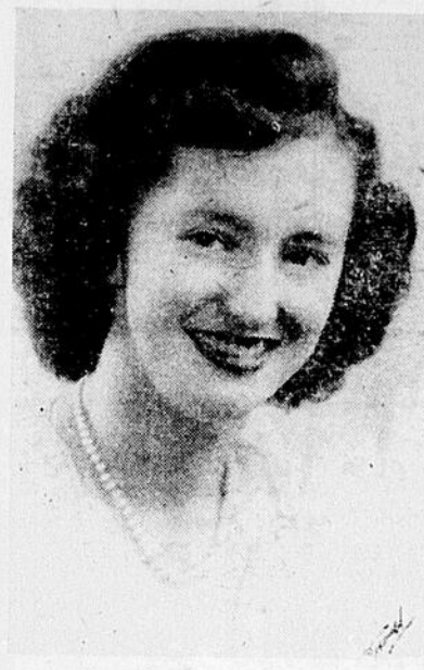
LOUISETTE MONTPETIT, Soprano coloratura, Vedette du Gala Artistique qui aura lieu à Beauharnois, le 24 janvier 1946.