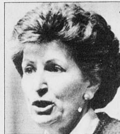
Lise Bacon : chez les « écolos ».