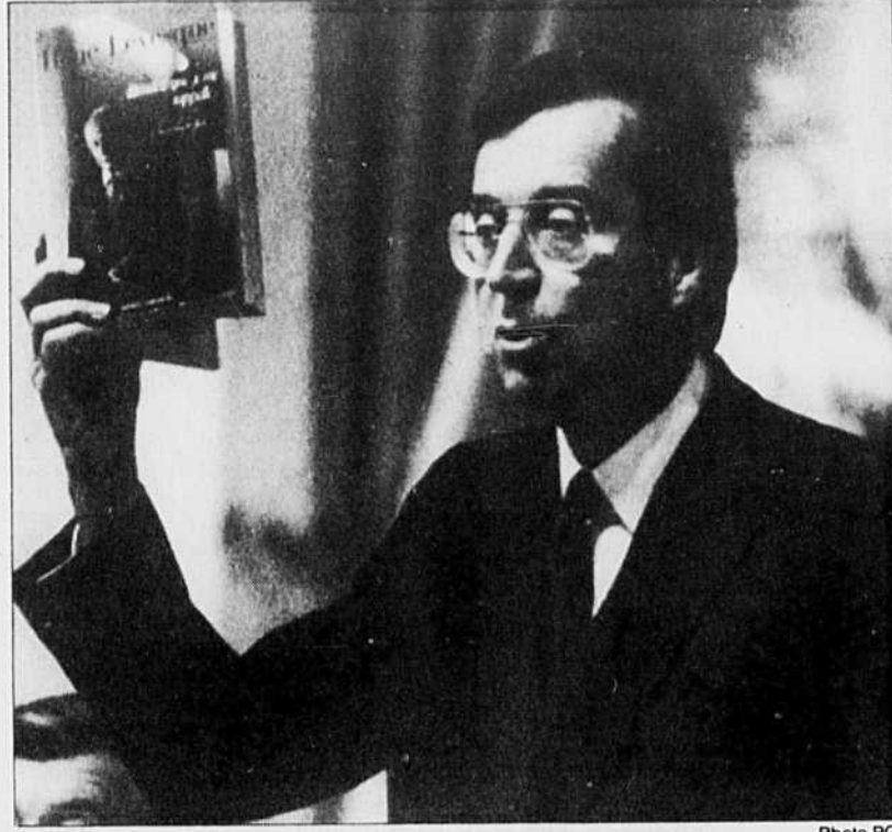
Au cours du débat sur le projet de loi 178, hier, à l'Assemblée nationale, le premier ministre Bourassa n'a pas hésité à exhiber le livre de René Lévesque pour appuyer sa position sur la langue.

M. Ryan n'est pas convaincu par l'opinion de la Cour suprême selon laquelle il existerait un lien vital et essentiel entre le discours commercial et le discours intellectuel, politique, culturel, social ou religieux. « La liberté du commerce, tout en étant un élément très important d'une vision libérale de la société, ne se situe pas au même niveau que les grandes libertés fondamentales que proclament les Chartes des droits humains depuis le deuxième conflit mondial. On ne trouve nulle part la liberté du commerce à l'état explicite dans les Chartes canadienne et québécoise des droits et libertés de la personne... Lorsque l'on parle du droit à l'affichage commercial et même du discours commercial, je pense qu'on peut introduire beaucoup de nuances et que la page 75 du jugement de la Cour suprême est loin d'être le dernier mot en ces matières. Le débat continuera. Je souhaite vivement qu'il continue et je