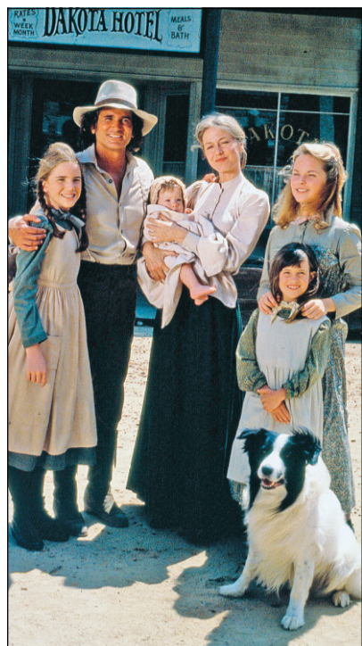
Pour les nostalgiques, Historia présentera La Petite maison dans la prairie , du lundi au jeudi, 17 h, à compter du 22 août.

Les nostalgiques ne vont plus se posséder : La Petite Maison dans